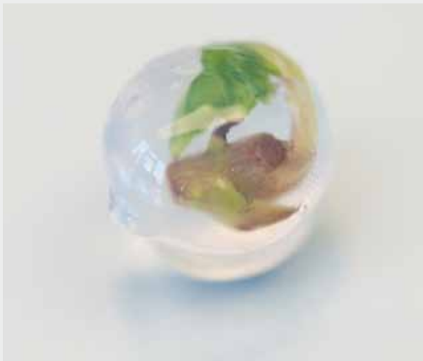
Microbille de vigne.

La bioencapsulation est une méthode de conservation couramment utilisée pour conserver les aliments, les molécules ou encore des échantillons liés à la médecine (éléments prophylactiques) ou à l'agronomie (enrobage de graines) (Chang 2012).