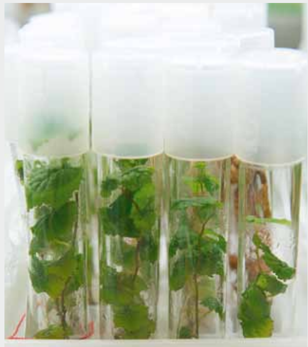
Figure 1 | Vignes en culture in vitro issues du conservatoire d'Agroscope.

artificielles ont été mises au point pour plusieurs espèces végétales cultivées, telles que les conifères (Attré et al. 1994), les plantes maraîchères (Ghosh et Sen 1994), fruitières (Pattnaik et Chand 2000), ornementales (Jainero et al. 1997), aromatiques (Sharma et al. 1994) et la pomme de terre (Lê et al. 2002; 2003). Dans la plupart des cas, on utilise des embryons somatiques pour la production de ces semences. Toutefois, l'utilisation des bourgeons axillaires ou d'autres parties végétatives peut être très intéressante pour la diffusion en masse et la conservation stable de diverses plantes. Dans le travail présenté ici, une étude a été entreprise pour évaluer la réalisation de semences artificielles de vigne par micro-encapsulation de bourgeons axillaires. Cette technique devrait permettre la conservation in vitro à long terme de matériel végétal de haute qualité. Ce procédé réalisable tout au long de l'année réduit de façon considérable les opérations conventionnelles de repiquage d'une collection in vitro .