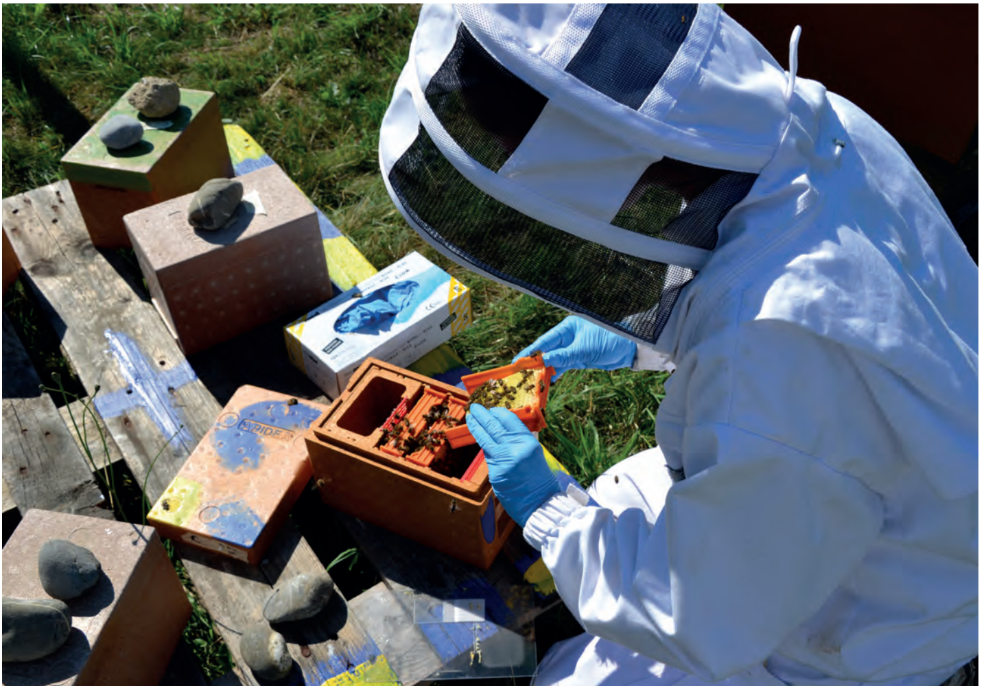
Beispiel für eine Feldstudie: Kontrolle der Entwicklung von Versuchsbienvölkern in Begattungskästchen.