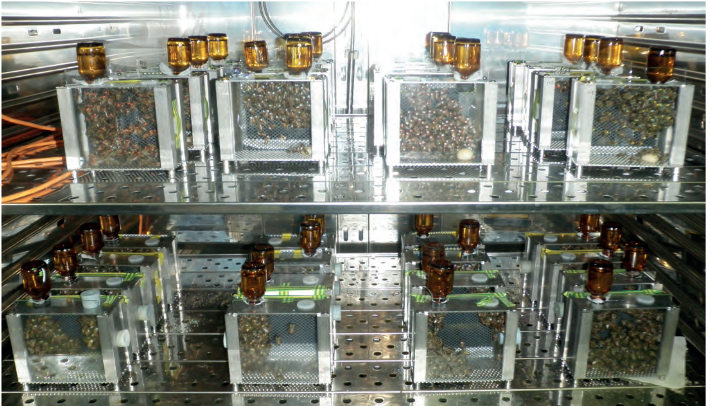
Beispiel für eine Laborstudie: Versuchskäfige mit Arbeiterinnen in einem Wärmeschrank.