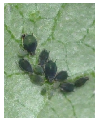
Photo 6: Colonie de puceron du melon et du cotonnier ( Aphis gossypii ) à la face inférieure d'une feuille de concombre.