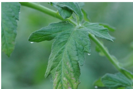
Photo 11: La persistance d'eau sur les feuilles favorise la cladosporiose sur les tomates.