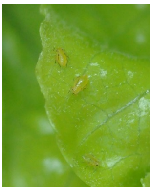
Photo 3: Individus juvéniles du puceron de la laitue ( Nasonovia ribisnigri ) sur une salade.