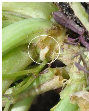
Photo 8: Larve de charançon (notamment Ceutorhynchus pallidactylus ) à la base d'une plante de mizuna.