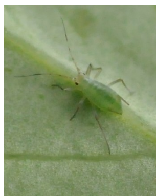
Photo 4: Jeune puceron vert du pois ( Acyrtosiphon pisum ) à la face inférieure d'une feuille de pois (photo: R. Total, Agroscope).