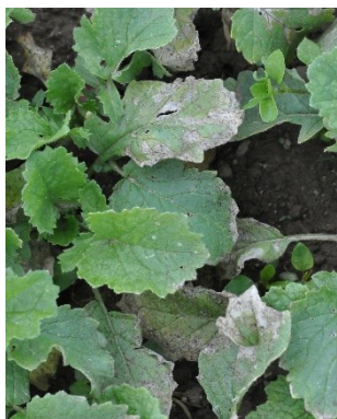
Photo 7: Une forte attaque de mildiou ( Peronospora parasitica ) est actuellement en cours sur radis de plein champ.