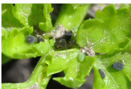
Photo 1: Puceron noir de la fève ( Aphis fabae ) et puceron du saule ( Cavariella aegopodii , vert, au centre de la photo) sur céleri pomme.

Le vol d'invasion de diverses espèces de pucerons attaquant les plantes cultivées se poursuit en cultures maraîchères. Les femelles de la génération invasive ont déjà donné massivement naissance à des juvéniles, et l'on constate un peu partout des déformations et décolorations de feuilles. Les foyers d'attaque sont repérables grâce aux nombreuses exuvies ou au miellat qui s'y trouvent. Contrôlez vos cultures, marquez les foyers d'infestation et faites un traitement si nécessaire.