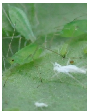
Photo 5: Pucerons à stries vertes de la pomme de terre ( Macrosiphum euphorbiae ) et exuvies sur tomates.