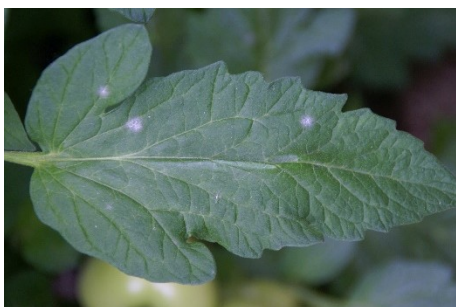
Photo 13: Feuille de tomate avec des taches foliaires blanches, arrondies et d'aspect farineux, typiques de l'oïdium.