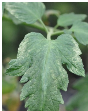
Photo 9: Taches chlorotiques aux bordant une feuille de tomate. La cause n'est pas déterminée: jusqu'ici aucun agent de l'acariose bronzée ( Aculops lycopersici ) n'a été détecté.