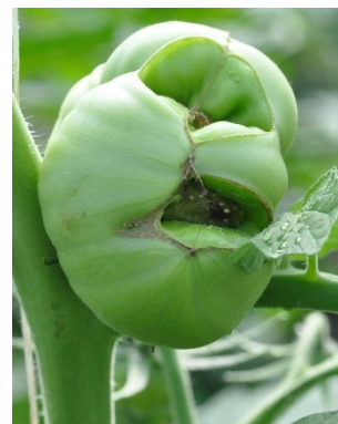
Photo 10: Certaines variétés de tomate peuvent subir des morsures de bourdons. Les fruits touchés éclatent, par exemple à l'extrémité du fruit. (photo: R. Total, Agroscope).