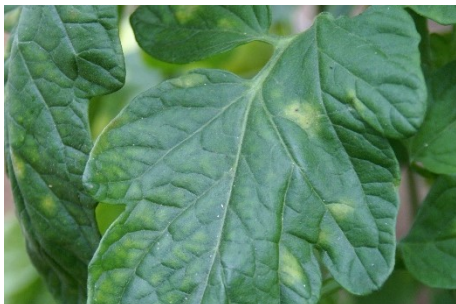
Photo 12: Taches jaunâtres de cladosporiose sur une feuille de tomate.