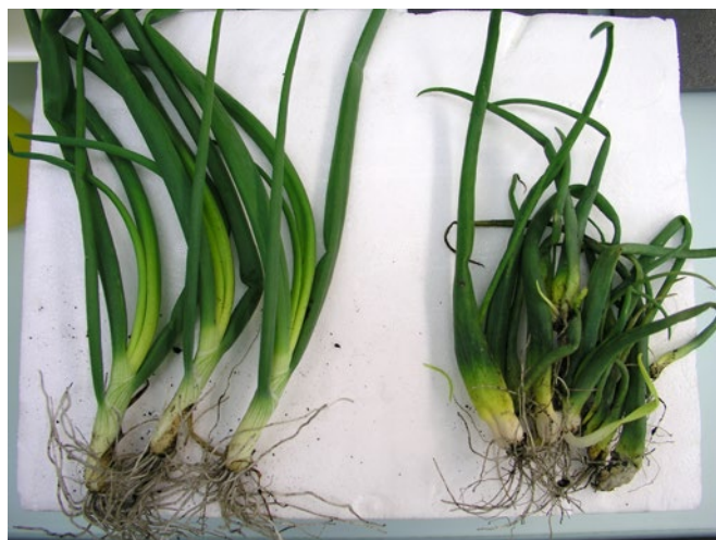
Fig. 3: Symptômes d'attaque de Ditylenchus dipsaci sur oignons. À gauche: plantes saines. À droite: plantes atteintes. Les feuilles sont déformées et plus courtes.

Une stratégie de gestion doit être basée sur les seuils de tolérance respectifs de l'espèce ou du genre de nématodes en présence. Selon l'espèce, on peut s'attendre à des dégâts lorsque la densité de la population dépasse 500 œufs et individus juvéniles par 100 ml de terre (à l'exemple de Heterodera spp.). Pour les espèces à large spectre d'hôtes et taux élevé de multiplication (par exemple Ditylenchus dipsaci ) il faut déjà s'attendre à des dégâts économiques avec plus d'un individu par 250 ml de terre (fig. 3).