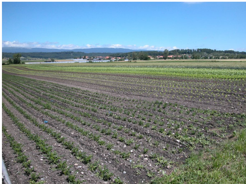
Cultures maraîchères en Suisse: diverses espèces et variétés se côtoient.