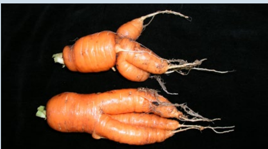
Fig. 7: Carottes avec racine principale fourchue et galles sur les radicelles suite à une attaque de M. hapla

Le nématode cécidogène du nord Meloidogyne hapla occasionne l'apparition de galles sur les racines et des déformations (par exemple division ou fourchage) chez les légumes racines (fig. 7). Ce ravageur a de très nombreuses plantes hôtes (plus de 550 espèces) et apparaît principalement sur carottes, salades, pois, haricots, chicorées-endives, scorsonères, céleris, oignons, poireaux, panais, choux et radis longs.