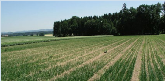
Fig. 5: Champ d'oignons présentant des zones caractéristiques de dépression de croissance causées par des nématodes phytophages du genre Pratylenchus spp..

En plus d'inhiber la croissance des plantes, les nématodes endoparasites migrateurs Pratylenchus spp. occasionnent aux racines des lésions nécrotiques brunes à noires (fig. 1). Ils s'attaquent à un grand nombre d'espèces végétales (plus de 350 espèces), et se manifestent principalement dans les cultures de carottes, pois, haricots, oignons (fig. 5), poireaux, scorsonères, céleris, choux, salades et épinards.