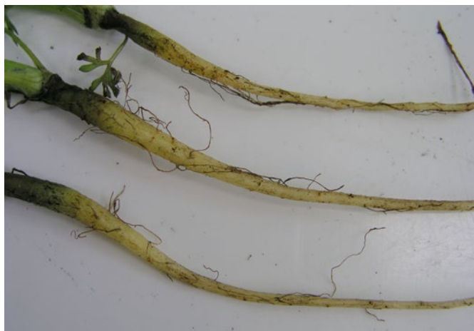
Fig. 1: Lésions brunâtres causées par une attaque de Pratylenchus spp. sur les radicelles de jeunes carottes jaunes du Palatinat.

Les cultures maraîchères sont un domaine important de l'agriculture suisse. La statistique relevait plus de 3500 exploitations maraîchères en 2016. Quelque 1300 d'entre elles, d'une surface respective de plus d'un hectare, produisaient à peu près 95 % de la quantité totale de légumes suisses dont l'ensemble commercialisé atteignait 457 000 t. En 2017, la surface cultivée en légumes était de 16 719 ha dont quelque 15 000 ha de cultures de plein champ. C'est ainsi que des légumes d'une valeur totale de 1.1 milliards de francs étaient produits sur 1 % à peu près de la surface agricole utile du pays (CCM 2018). Ce montant correspond