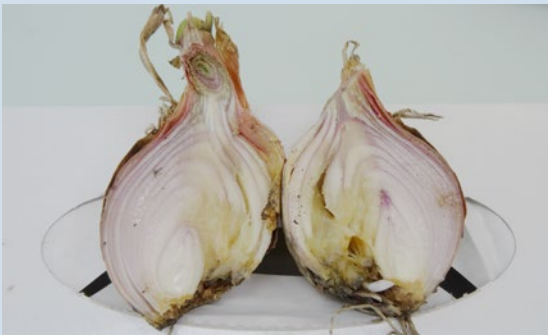
Fig. 6: Une forte prolifération de Ditylenchus dipsaci entraîne la pourriture humide des oignons.

L'attaque du nématode des tiges Ditylenchus dipsaci occasionne un jaunissement et une déformation des tiges (fig. 3) ainsi qu'un épaississement des tiges et de la base des feuilles, et une frisure des feuilles. Le nombre de ses plantes hôtes dépasse 500, entre autres les oignons, poireaux, haricots, pois, bettes, betteraves à salade en cultures maraîchères et les betteraves sucrières et fourragères, féverole et soja en grandes cultures.