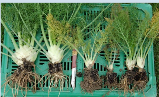
Fig. 8: Prolifération de racines secondaires sur des plantes de fenouil suite à une attaque de Paratylenchus spp. À gauche: plantes normalement développées. À droite: plantes avec fort développement de racines secondaires (chevelu racinaire) et croissance nettement réduite.

Les ectoparasites migrateurs du genre Paratylenchus causent principalement la formation de racines secondaires anormales (chevelu racinaire) et des racines hérissées. Les cultures touchées sont par exemple les carottes, céleris, fenouils, radis, épinards, choux et salades.