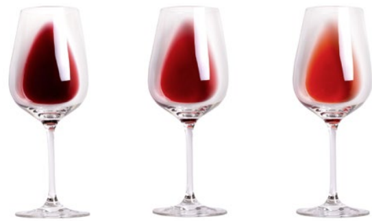
Abb. 3: Welcher der drei Weine hat das intensivste Aroma? «Halo-Effekt»: Aufgrund einer bekannten Eigenschaft (hier die Farbe) wird (fälschlicherweise) auf eine unbekannte Eigenschaft (hier das Aroma) geschlossen.

Generell sind die menschlichen Sinne nicht über alle Zweifel erhaben – sie lassen sich leicht täuschen. So hält beispielsweise Albers (1963) fest, «dass ein und dieselbe Farbe unzählige Wahrnehmungen hervorruft», je nachdem in welchem Kontext sie sich befindet. Einem Produkt werden häufig aufgrund der Optik gewisse Eigenschaften zugeschrieben, die im Endeffekt jedoch nicht zwingend zutreffen müssen. So wurden in einer Studie diverse Studenten gebeten, einen Rotwein zu degustieren und ihn mit Rotwein-Aromarichtungen zu beschreiben. De facto wurde den Studenten jedoch kein Rotwein, sondern ein mit Lebensmittelfarbe gefärbter Weisswein zur Degustation gegeben – wahrgenommen wurde der Weisswein aufgrund der Farbmanipulation als Rotwein, die Aromarichtungen wurden entsprechend aufgeführt (Morrot, Brohet und Dubourdieu 2001). In einer früheren Studie von DuBose et al. (1980) wurde ein Kirschensaft farblich manipuliert, wobei eine orange Farbe in häufigen Fällen ein entsprechendes Orangenaroma hervorrief. Mit einem