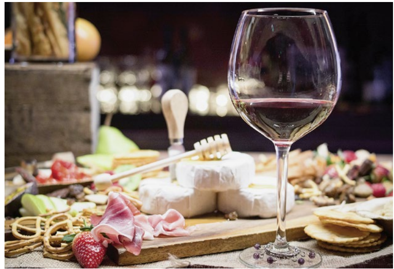
Abb. 3: Süsswein und Käse, ein klassisches Beispiel für Food-Wine-Pairing. Salzigkeit, umami, Süsse und Säure bilden ein möglichst harmonisches Ganzes.

So komplex die Eigenheiten der Geschmackswahrnehmung sind, so anspruchsvoll sind die daraus entstehenden Herausforderungen. Der Geschmack ist die wohl wichtigste Grundlage für die Beliebtheit vieler Produkte. Daher gilt es, sich wohl zu überlegen, wie die Reihenfolge der Produkte in einer Verkostung unsere Wahr-