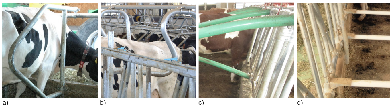
Fig. 4: Différentes façons de fixer les séparations autoportantes: a) Entreprise B+M, b) Entreprise Zimmermann, c) Entreprise Schauer, d) Entreprise Krieger (Photos: Agroscope (a), Entreprise Zimmermann (b), Entreprise Schauer (c), Entreprise Krieger (d)).

s'intitule «aire d'affouragement surélevée avec des séparations (stalles d'alimentation)».