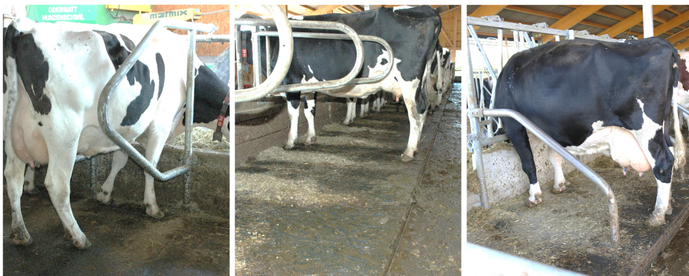
Fig. 3: Exemples de différentes séparations, installées dans la pratique: a) Entreprise B+M, b) Entreprise Hörmann, c) Entreprise Zimmermann.