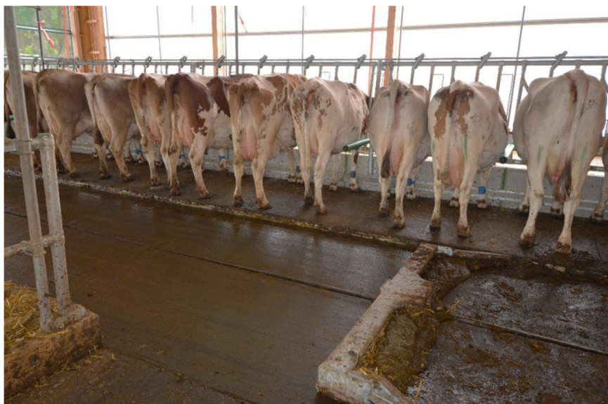
Fig. 2: Les animaux ne sont pas gênés par le fonctionnement du racleur d'évacuation du fumier.

Afin de maintenir la stalle aussi propre et sèche que possible, il est nécessaire d'installer des séparations toutes les deux stalles d'alimentation (Zähner et al. 2013). Il existe plusieurs modèles de différents fabricants sur le marché. Ils peuvent être répartis en séparations fixées au sol et en structures autoportantes. Quelques exemples sont présentés à la figure 3. Dans le cas des structures autoportantes, il est important de veiller à ce que la séparation soit fixée à l'avant, car si les vaches heurtent la séparation, des forces importantes peuvent s'exercer à ce niveau à cause de l'effet de levier.