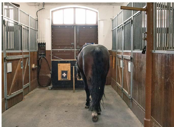
Figure 1 Étalon en phase de test.

Uller C., Lewis J., 2009. Horses ( Equus caballus ) select the greater of two quantities in small numerical contrasts. Animal Cognition 12 (5), 733–738.