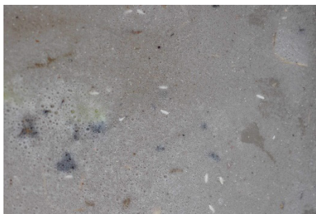
Photo 8: Œufs de mouche du chou extraits d'un échantillon de sol d'un site menacé.