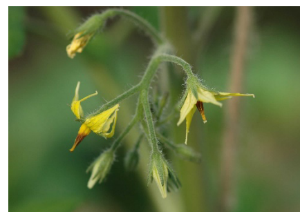
Photo 4: Traces brunes des griffures de bourdons sur les cônes staminaux des fleurs de tomates. Ces marques témoignent d'une bonne pollinisation. En cas de déficience, on peut y suppléer en frappant les fils de palissage (pollinisation „manuelle“).