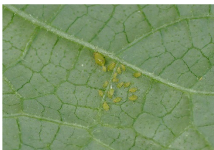
Photo 5: Il est indispensable de contrôler régulièrement les cultures de légumes fruits sous verre pour y surveiller la présence de pucerons, dont on peut observer une forte prolifération dans certains sites.