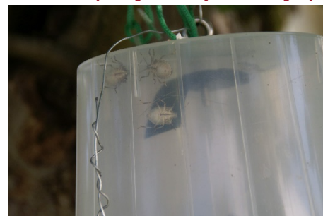
Photo 1: Punaises marbrées capturées dans un piège à phéromone (été 2018).

Jusqu'à ce mardi, une seule punaise marbrée avait été capturée dans nos pièges installés sur les sites surveillés. Nous en déduisons qu'en ce moment, les populations d' Halyomorpha halys quittent leurs quartiers d'hiver en ordre très dispersé plutôt qu'en vols denses. Cependant, dès que les températures moyennes journalières passeront au-dessus de 10-12°C, il faut s'attendre à une intensification des migrations. Nous en suivons le développement.