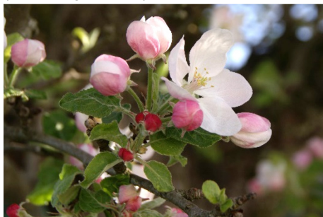
Photo 9: La pleine floraison du pommier (ici le cultivar Roter Sauergrauch) coïncide à peu près avec le début du vol de la mouche de la carotte.