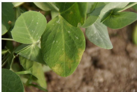
Photo 11 : Tache foliaire jaunâtre aux contours flous, à la face supérieure d'une feuille de pois. À la face inférieure de la feuille, sous cette tache, on trouvera le feutrage velouté grisâtre des sporanges du mildiou.