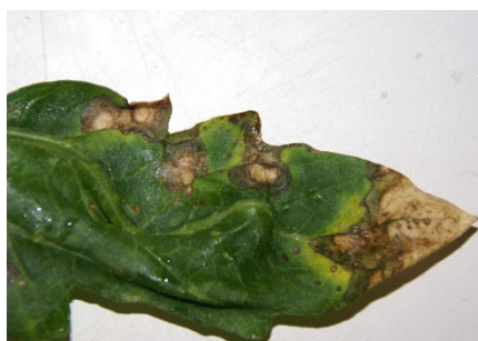
Photo 6: Taches foliaires apparaissant souvent au printemps sur des plants de tomate. Elles ont été attribuées à des brûlures, du fait qu'aucun pathogène, comme Alternaria sp par exemple, n'y a été détecté.