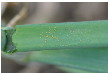
Photo 10 : Les larves de thrips vivent cachées entre les gaines foliaires des oignons.