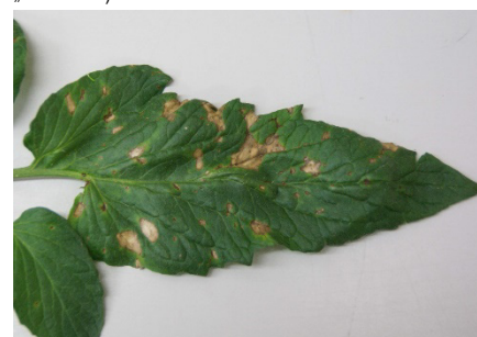
Photo 7: Cette feuille de tomate montre des taches foliaires causées par Alternaria ( A. solani ), dont les attaques sont surtout fréquentes en plein été. Un diagnostic sûr ne peut toutefois être établi que par un examen au microscope.