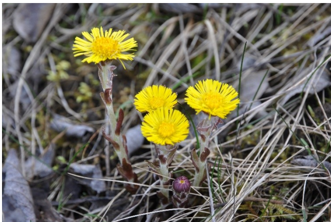
Abbildung 1: Im frühen Frühjahr blüht der Huflattich charakteristisch gelb. Die Blätter erscheinen erst nach der Blüte.

Die Pflanze ist zur Blütezeit 10–15 cm, später bis 30 cm hoch 3 . Die eigentlichen Blätter treiben erst nach der Blüte aus und sind zuerst beidseitig graufilzig, behaart. Später «verkahlt» die Blattoberseite 3 . Die Blätter sind herzförmig, langgestielt und die Blattspitze kann bis über 20 cm lang werden. 3