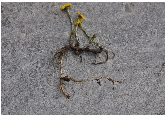
Abbildung 2: Huflattich mit Blütenständen und Rhizomen. Der Huflattich vermehrt sich über Samen und vegetativ über Rhizome im Boden. Werden diese durch Maschinen geteilt und im Feld verteilt, entstehen aus den Stücken neue Pflanzen.