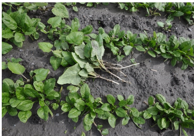
Abbildung 3: Huflattichnest in einem Spinatfeld.