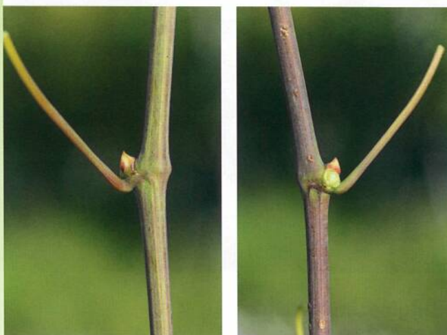
Rameau herbacé face ventrale (à gauche) et dorsale (à droite).