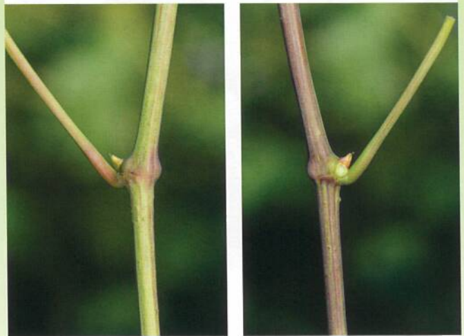
Rameau herbacé face ventrale (à gauche) et dorsale (à droite).