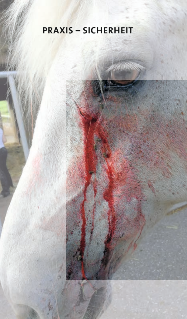
Verletzung durch hervorstehende Teile. (links)

Ein plötzliches Erschrecken und bruskes Hochschnellen des Kopfes kann gefährlich werden. (Mitte)