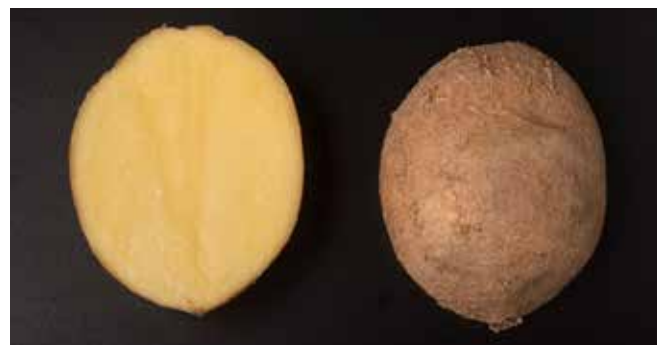
Abbildung 2 | Thalessa ist eine mittelfrühe Verarbeitungssorte für Chips mit gelbem bis hellgelbem Fleisch und guter Eignung zur Lagerung, auch bei tiefer Temperatur. Sie erreicht eine gute Knollenbildung und einen guten Ertrag. Thalessa ist anfällig gegenüber Rhizoctonia-Pocken und ihr Kraut gegenüber Phytophthora infestans .