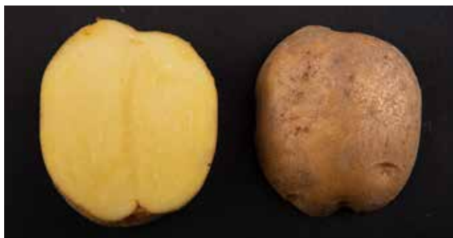
Abbildung 1 | Sorentina ist eine mittelfrühe Verarbeitungssorte für Chips mit hellgelbem bis gelbem Fleisch und guter Eignung zur Lagerung, auch bei tiefer Temperatur. Sie erreicht eine gute Knollenbildung und einen ziemlich guten Ertrag. Sorentina ist anfällig gegenüber Rhizoctonia-Pocken, dem Kartoffel-Y-Virus (PVY) und das Kraut gegenüber Phytophthora infestans . (Foto: Carole Parodi, Agroscope). www.agridea.ch | www.swisspatat.ch | www.agroscope.ch

Die Hauptsortenliste beinhaltet Sorten, die auf dem Schweizer Markt von Bedeutung sind. Die wichtigsten Eigenschaften sind in der Tabelle mit Farben dargestellt. Die kräftigen Farben fassen die im Versuchsnetz von Agroscope/swisspatat beobachteten Merkmale zusammen. Blasse Farben weisen darauf hin, dass es sich um