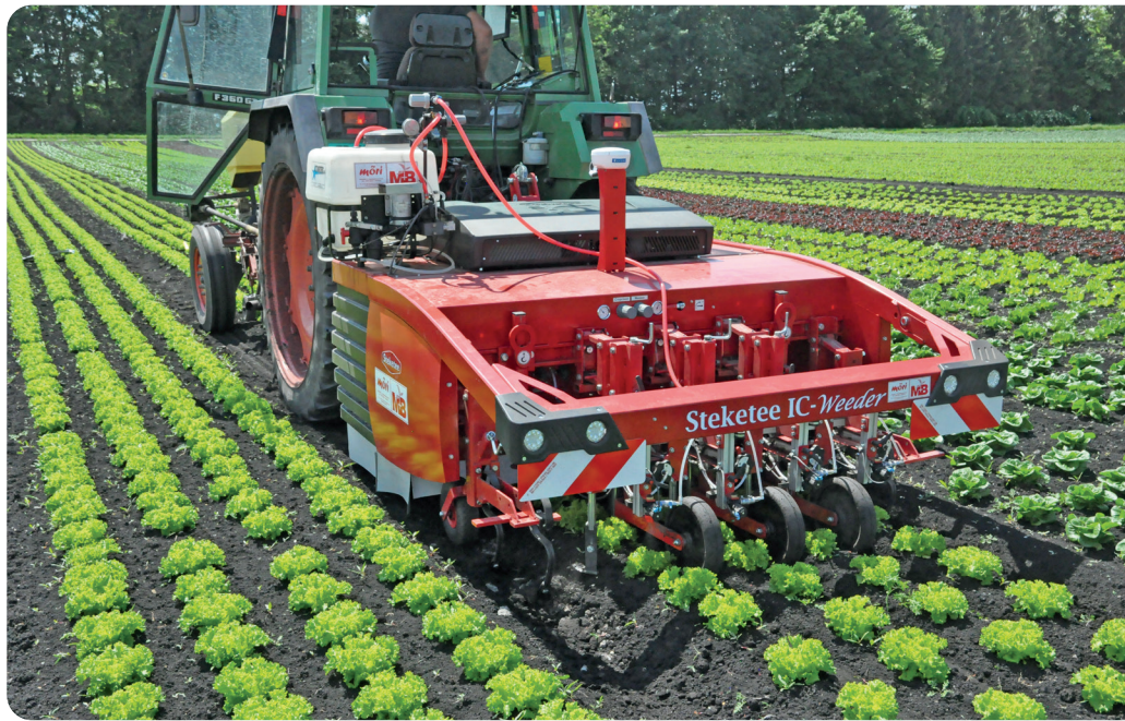
Der Pflanzenschutzmittel-Roboter kann vier Pflanzenreihen gleichzeitig behandeln.

Mit dem PS-Roboter wurden in den vergangenen Jahren Testfahrten in verschiedenen Salaten, Pakchoi, Sellerie und gepflanzter Petersilie durchgeführt. In frühen Kulturstadien – dem geplanten Einsatzfenster – funktionierte der Prototyp sehr gut. Nahezu alle Kulturpflanzen wurden jeweils behandelt und die Unkräuter gehackt. Ausnahmen gab es: Wuchs das Unkraut in un-