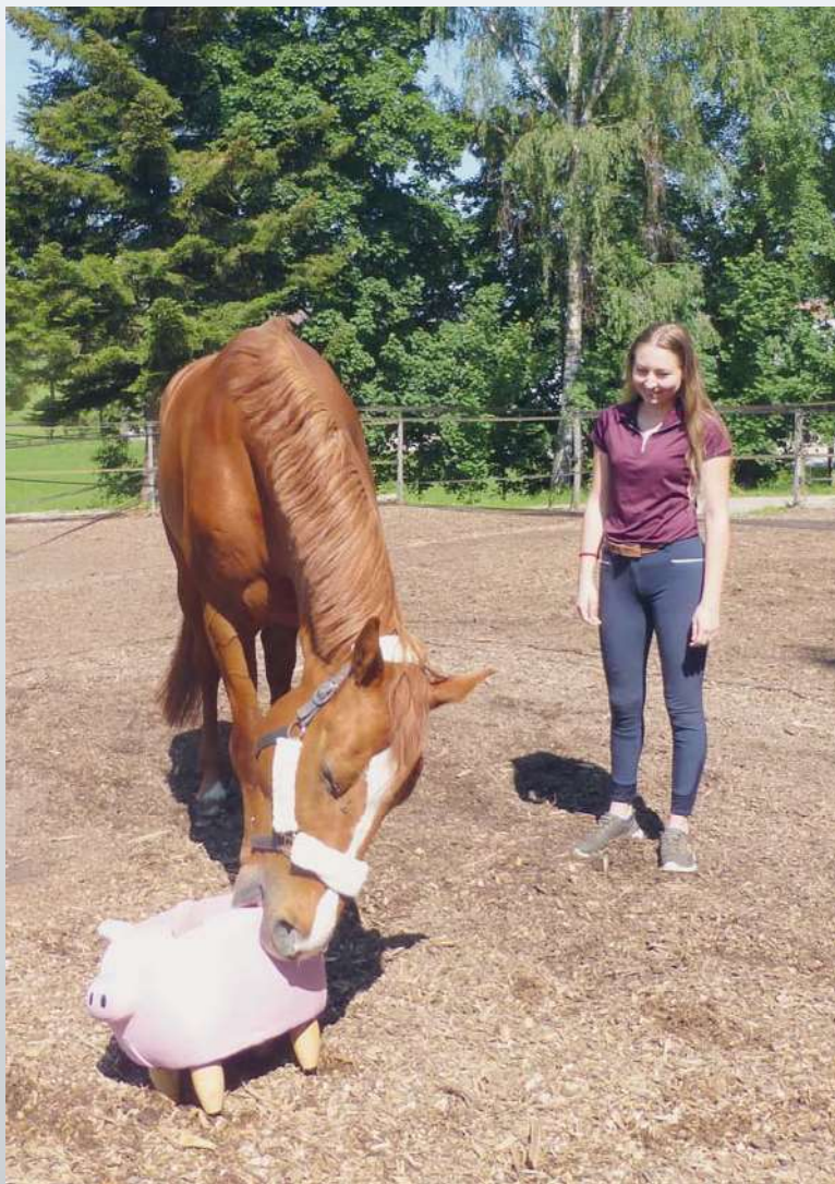
Photo 2 : Les couples cheval – propriétaire ont été confrontés aléatoirement à trois objets inconnus. Ici un cochon en peluche.

Les analyses ont montré que 96% des chevaux ont fait au moins un regard référentiel en direction de leur propriétaire pendant les tests. Le premier critère pour parler de référencement social est donc rempli. Elles ont également démontré que plus les chevaux ont fait de regards référentiels, moins ils se sont approchés et ont passé de temps à interagir avec l'objet et plus ils ont interagi avec leurs propriétaires. Ces résultats nous laissent supposer que les chevaux font des regards référentiels lorsqu'ils sont inquiets face à un objet inconnu. Ils semblent donc effectivement chercher des informations auprès de leurs propriétaires quand ils se trouvent dans une situation ambiguë. En revanche, le deuxième critère important pour parler de référencement social, l'adaptation comportementale en fonction de l'émotion exprimée par le ou la propriétaire, n'a pas pu être observé. En effet, aucun effet de l'émotion exprimée par le ou la propriétaire sur les différents paramètres mesurés n'a pu être mis en évidence.