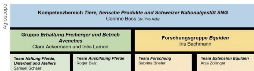
Das neue Organigramm des SNG

Pour remplir ces tâches, le Haras détient des équidés et met à disposition des infrastructures et des installations. Pour leurs activités, Agroscope et donc le HNS s'orientent sur des programmes d'activité de quatre ans, qui définissent le cadre de leurs recherches et activités en fonction des défis actuels de l'agriculture. Parallèle-