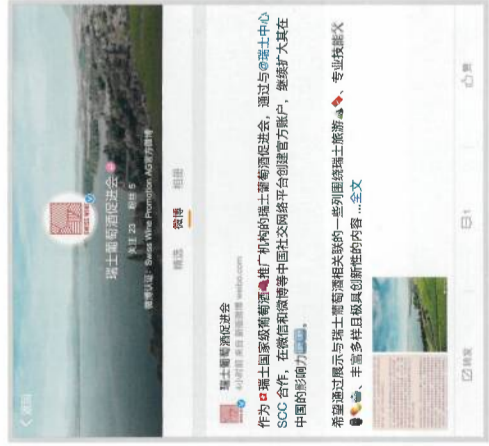
SWP-Profil auf der chinesischen Plattform Weibo.

Vor diesem Hintergrund und auf Wunsch der Partner setzt SWP jetzt neben der physi-