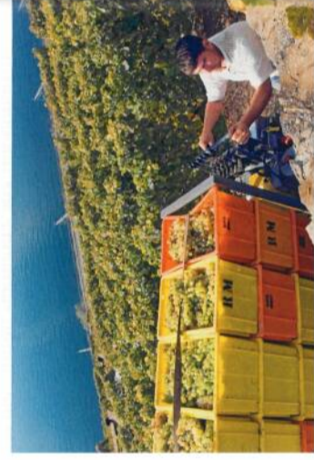
Abb. 1: Erntereif: Chasselas-Trauben am Genfersee.

mein späte Reifebeginn aus. Dies ändert sich grundlegend von Beginn der 1940er bis zum Beginn der 1950er-Jahre. In dieser Zeit reiften die Trauben häufig sehr früh und bereits zu denselben Zeiten wie heute. Auf diese Zeitspanne folgten ungefähr 30 kühlerere Jahre mit entsprechend späteren Reifezeiten.