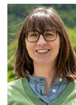
Esther Bravin Obstbau Ökonomie