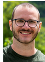
Samuel Cia Sortenprüfung Kernobst, Projekt AquaSan