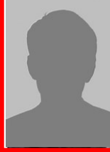
vakant Sortenprüfung und Physiologie Steinobst