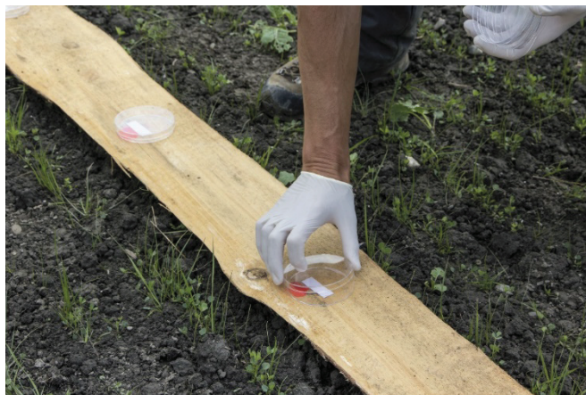
Abb. 2: Nach der Behandlung werden die Kollektoren eingesammelt. Die Analyse erfolgt im Labor.

Die Durchführung von Driftversuchen ist international normiert gemäss ISO-Standard 22866 «Equipment for crop protection - Methods for field measurement of spray drift». Vor einer Behandlung werden ab Feldrand in mehreren Abständen Kollektoren aufgestellt. Das können beispielsweise Petrischalen oder auf Holzplatten befestigte Filterpapierstreifen sein (Abb. 1, S. 1). Die Behandlung erfolgt mit einem Tracer (Farbsubstanz), der einfach zu messen ist. Der Wind muss während der Überfahrt möglichst rechtwinklig zur Behandlungsrichtung, d.h. quer zur Kultur, wehen und mit einer gewissen Stärke. Nach der Behandlung werden die Kollektoren eingesammelt und die «eingefangene» Menge Tracer im Labor gemessen (Abb. 2). Anhand dieser Messungen sieht man dann, wieviel man von der ausgebrachten Menge beispielsweise nach 1m, 5m und 20m vom Feldrand noch findet.