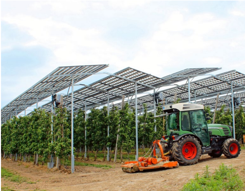
Apfelanlage mit einer Agri-PV-Anlage.

Aktuelle Agri-PV-Projekte fokussieren den Aspekt 1, wie z.B. festaufgestellte Photovoltaik bei Beerenkulturen. Ein Beispiel für Aspekt 2 ist eine dynamische Agri-PV-Anlage zur Reduktion des Ertragsausfalls bei Steinobst, Kernobst oder Reben aufgrund von Spätfrost.