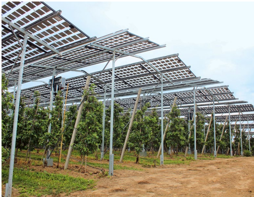
Agri-PV-Anlagen können Ertragsschwankungen der Betriebe abfedern.

Die Zusammensetzung der Kosten für die Produktion von Beeren, Obst und Reben und die Produktion von Strom sind sehr unterschiedlich. Bei Äpfeln zum Beispiel machen die Arbeitskosten 44% der totalen Produktionskosten, die Abschreibung der Obstanlage und Infrastruktur (Investitionskosten) 22%, die Sachkosten 17%, die Maschinen- und Gerätekosten 15% und weitere Kosten 2% aus. Bei