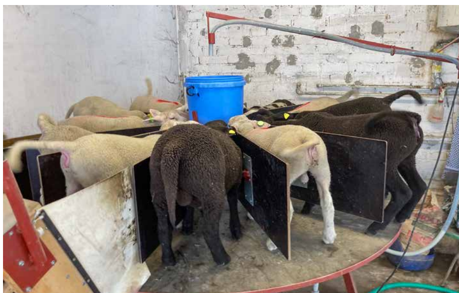
Für das Tränken der vielen Jungtiere werden zum Teil einfallsreiche Lösungen gefunden. Certaines solutions sont parfois ingénieuses pour abreuver les nombreux jeunes animaux.

Die gefundenen Werte an Gammaglobulinen im Blut entsprachen in etwa dem, was aufgrund der Literaturwerte zu erwarten war. Die Gehalte an Gammaglobulinen schwankten jedoch sowohl bei Lämmern als auch bei Gitzli stark zwischen Tieren und Betrieben. Im Durchschnitt lagen die Gammaglobulinwerte bei den Gitzli mit 1.37 g/dl deutlich über den 0.94 g/dl bei den Lämmern. Die Werte waren erwartungsgemäss abhängig vom Alter bei der Blutentnahme; je älter das Tier, desto niedriger war sein Wert.