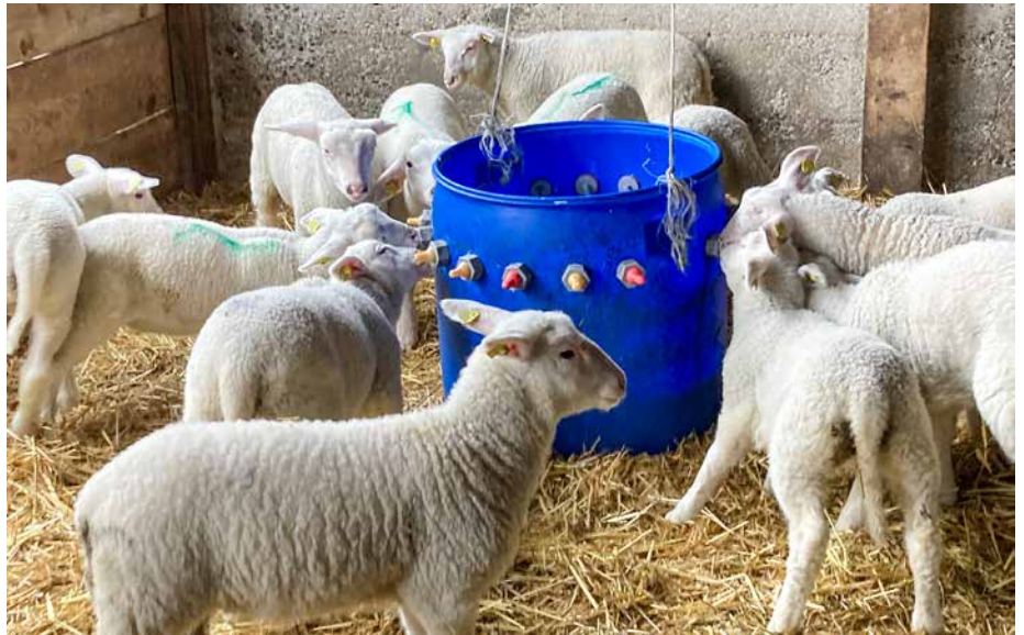
Steigrohrtränken werden auf manchen Milchschafbetrieben in der ad libitum-Fütterung genutzt. Les abreuvoirs à colonne montante sont utilisés dans certaines exploitations de brebis laitières pour l'alimentation ad libitum.

HANNA VOIGT | ANTONIA RUCKLI | PATRIK ZANOLARI | NINA KEIL