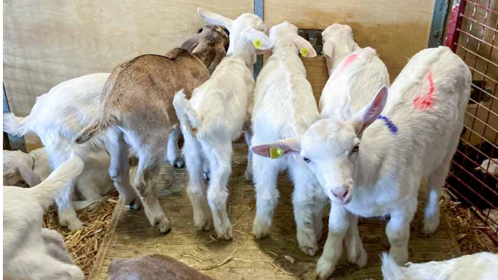
Freie Bedienung am Tränkeautomaten. Self-service à l'automate à buvée.