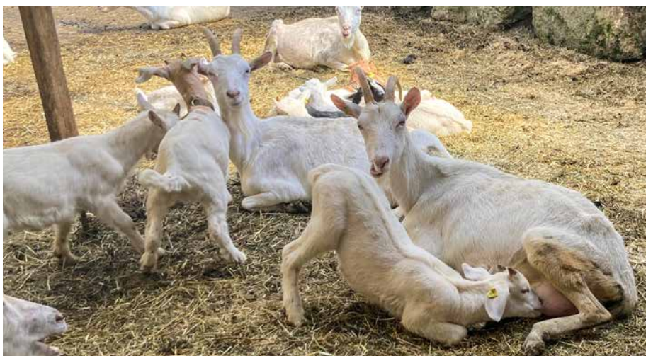
Nachzucht und Masttiere werden auf den Geburtsbetrieben meistens gleich gemanagt. Les animaux d'élevage et les animaux d'engraissement sont généralement gérés de la même manière dans les exploitations de naissance.

Neben Durchfall waren bei Sauglämmern und -gitzi (V1 und V2) vor allem Nabel- und Hautveränderungen, zumeist Lippengrund, vertreten (Tabelle 2, Seite 16). Lungenauffälligkeiten waren ein regelmässiger Befund bei Lämmern in V2 und V3. Bei V2 kranke Lämmer hatten nachweislich schlechtere Zunahmen. Bei Nachverfolgung der untersuchten Tiere per TVD nach Abschluss des Versuchs waren 6% der Gitzi und 11% der Lämmer als verendet gemeldet. Aus den erhobenen Gewichten der Tiere wurde die durchschnittlich tägliche Gewichtszunahme errechnet. Während die Durchschnittswerte im Zeitraum V1 und V2 für Lämmer bei 238g/Tag und bei Gitzi bei 223g/Tag lagen, waren die Zunahmen breit verteilt. Bei