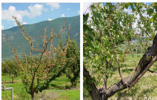
Figura 1: Deperimento dei rami

Sulle foglie infette, compaiono inizialmente caratteristiche macchiette necrotiche, piccole e tondeggianti e di colore marrone scuro, che vanno aumentando di numero. Le foglie più colpite possono cadere precocemente. L'infezione batterica sulle foglie o sui fiori rimane generalmente localizzata, in quanto i batteri faticano a penetrare nel germoglio e causarne la necrosi. Sui frutticini, la malattia si manifesta sotto forma di gocce di essudato gommoso, dapprima chiare poi scure e infine mummificate, che fuoriescono dai tessuti. Sui tronchi e sui rami, l'infezione batterica provoca il disseccamento, con la conseguente comparsa di fessurazioni e tumefazioni. In corrispondenza delle fessurazioni sui tronchi, sulle branche principali o sui rami si osserva la fuoriuscita di essudati gommosi rossastri. I tessuti necrotizzati, col tempo, evolvono in cancri, che portano al deperimento dei rami e delle branche o, addirittura, alla morte dell'intera pianta nei casi più gravi.