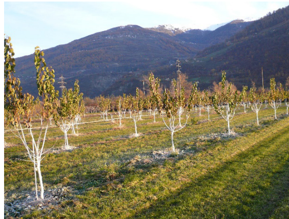
Figura 3: Imbiancatura a calce degli alberi giovani

Nei primi anni di impianto del frutteto, l'imbiancatura, che consiste nello spennellare con latte di calce il tronco e la base delle branche principali, protegge le piante dalle malattie crittogamiche o batteriche. Effettuata alla fine dell'estate o all'inizio dell'autunno, questa pratica protegge i tronchi e impedisce che costituiscano le porte d'entrata per le malattie.