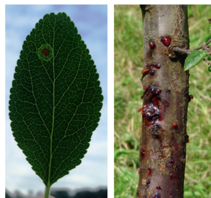
Figura 2: Macchia necrotica su una foglia (a sinistra); essudati gommosi bruno-rossastri su un ramo (a destra)