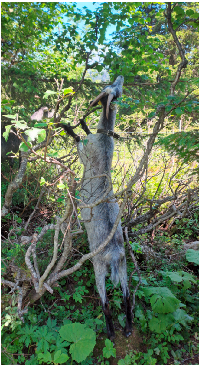
Une chèvre qui consomme les feuilles d'un aulne vert.

https://doi.org/10.34776/afs16-8 Date de publication: 30. Janvier 2025