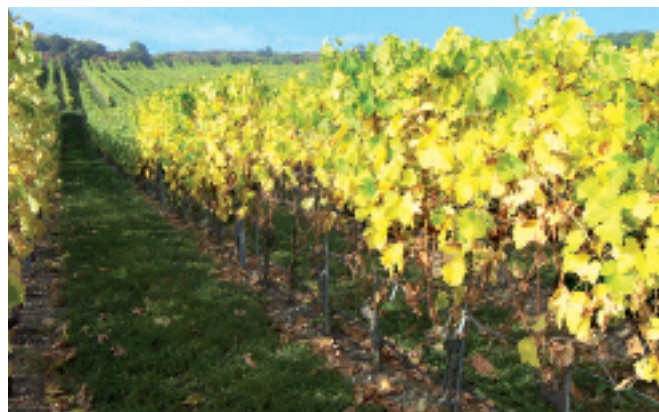
Vigne souffrant d'un manque d'eau.