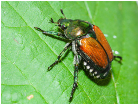
Abb. 1: Adulter Japankäfer.

im Kanton Wallis südlich des Simplonpasses Käfer gefangen. Ebenfalls 2023 wurde eine kleine isolierte Population in Kloten (ZH) entdeckt, 2024 eine in der Region Basel sowie weitere in den Kantonen Solothurn und Schwyz. 2025 wurden weitere Ausbrüche in den Kantonen Luzern, Genf und Waadt sowie dem Bündner Misox beobachtet. Darüber hinaus wurden seit 2021 nördlich der Alpen einzelne Individuen entlang von Hauptverkehrsachsen gefangen.