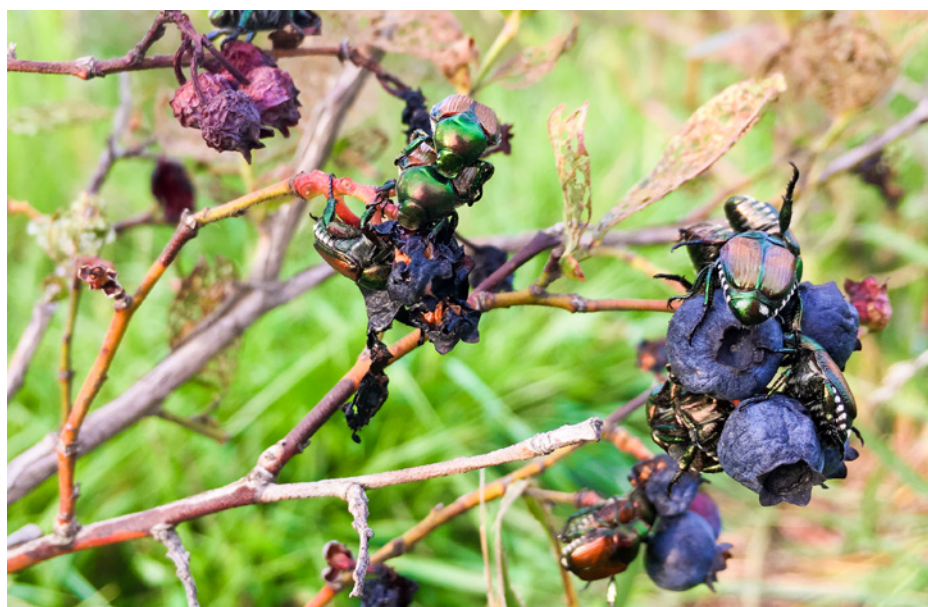
Abb. 3: Von Japankäfern befallene Heidelbeeren.

Die Weinrebe ist die bevorzugte Wirtspflanze des Japankäfers und 2025 wurden auch erstmals bedeutende wirtschaftliche Schäden in Tessiner Rebbergen beobachtet (Abb. 4). Zwischen Juni und Juli kann in befallenen Rebbaugebieten eine grosse Anzahl adulter Käfer beobachtet werden und es wurden auch schon 200 bis 300 Japankäfer pro Rebstock im Tessin oder dem Piemont gezählt. Der Japankäfer verursacht mehrheitlich skelettartig abgefressene Blätter, wobei bei einigen Sorten die Blätter vollständig gefressen werden können. Die meist noch unreifen Beeren werden jedoch nur selten vom Japankäfer befallen. Typischerweise beginnt der Frass der adulten Japankäfer an jungen Blättern an der Spitze der Rebe und Blattschäden sind daher in den oberen Teilen der Laubwand am grössten. In den USA kann die Blattfläche in besonders gefährdeten Rebbergen um bis zu 50 Prozent reduziert werden (Hammons et al., 2010). Geringer Blattverlust von bis zu 6.5 Prozent hat keine direkten Auswirkungen auf das Triebwachstum, den Ertrag und die Fruchtqualität der Trauben. Jedoch verringerte Blattfrass die Kälteresistenz neu gepflanzter Rebstöcke. Gu & Pomper (2008) testeten 32 Rebsorten verschiedener Vitis-Arten und stellten fest, dass europäische und