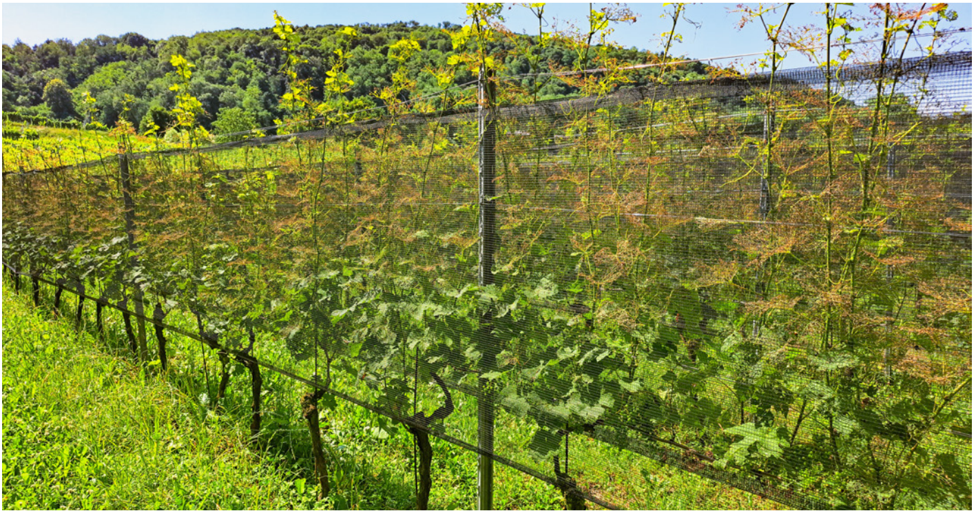
Abb. 4: Von Japankäfern befallene Tessiner Reben.

zwingend auf Anweisung der kantonalen Pflanzenschutzdienste erfolgen. Die Ernteperiode einiger Kulturen wie Kirschen, Aprikosen und verschiedenen Beerenarten fällt zeitlich mit dem Befall adulter Japankäfer zusammen, was Insektizidbehandlungen aufgrund der einzuhaltenden Wartefristen vor der Ernte stark einschränkt. Die applizierte Menge und die Rückstände auf dem Erntegut könnten jedoch mittels Spotspraying deutlich reduziert werden. Bei dieser vielversprechenden Massnahme werden die Adulten mit Lockstoffen in bestimmte Bereiche der Kultur gelockt, welche später mit Insektiziden behandelt werden. Daneben werden heute von Agroscope und anderen Akteuren weitere biologische und alternative Bekämpfungsmassnahmen entwickelt und getestet.