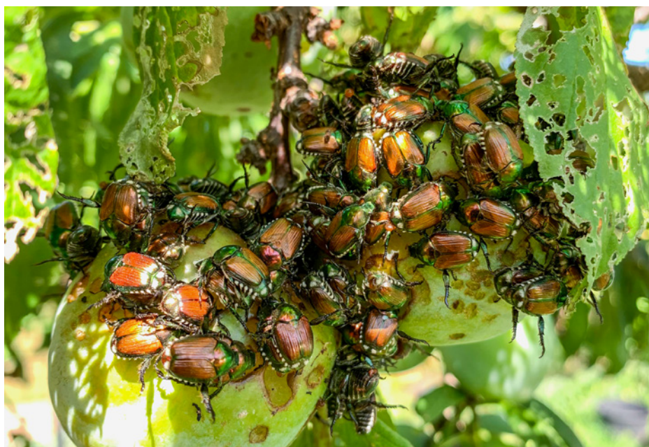
Abb. 2: Von Japankäfern befallene Zwetschgen.

Bedeutender als der Primärschaden durch die Japankäferlarven sind häufig Sekundärschäden, welche durch Wildtiere wie Wildschweine, Dachse oder Krähen bei ihrer Nahrungssuche nach Engerlingen im Boden verursacht werden. Besonders gefährdet durch Larvenbefall sind feuchte Wiesen und Weiden, bewässerte Sport- und Freizeitplätze sowie Baumschulen und Produktionsparzellen von Rollrasen. Engerlinge und adulte Japankäfer können beträchtliche ökonomische Schäden an Kultur- und Zierpflanzen verursachen. Die Europäische Union hat dabei das jährliche Schadpotenzial ohne wirksame Bekämpfung auf rund 2.4 Milliarden Euro geschätzt (Sanchez et al., 2019; Straubinger et al., 2022). Nach Einschätzung von Fachleuten wird sich der jährliche Ertragsausfall in der Schweiz ohne Bekämpfungsmassnahmen im zwei- bis dreistelligen Millionenbereich (Fr.) bewegen, wobei sich das Risiko für die einzelnen Kulturen stark unterscheiden kann. Basierend auf einer kürzlich erschienenen Literaturübersicht zur Biologie, Ausbreitung, Überwachung und Bekämpfung des Japankäfers (Kehrl et al., 2025a) schätzen