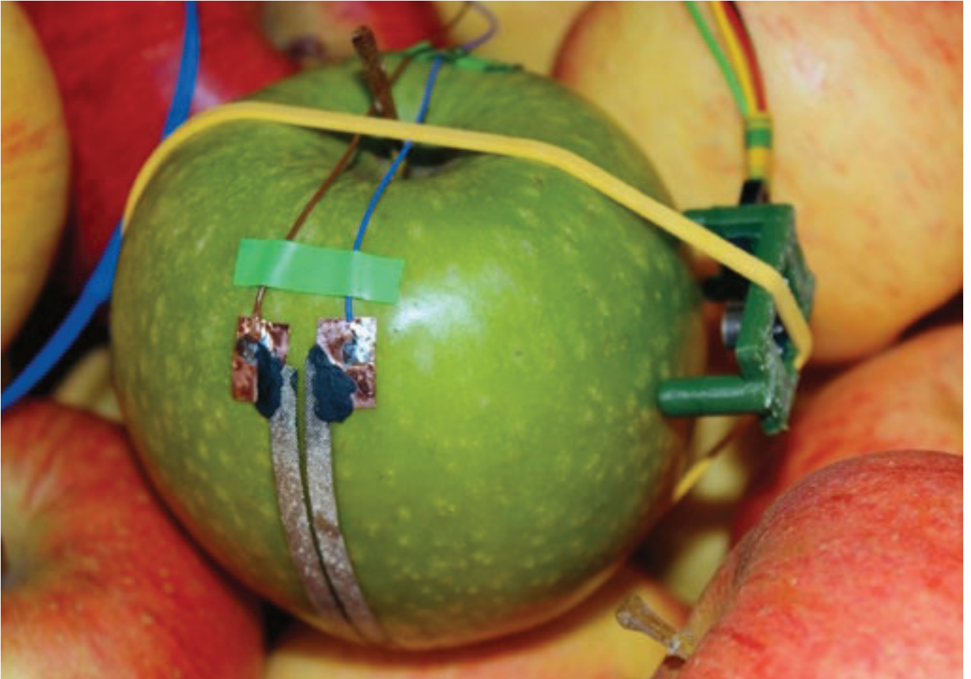
Capteurs sur les fruits.

Traditionnellement, la récolte des pommes dans la région du lac de Constance et en Suisse est lancée avec la Journée de la conservation. En collaboration avec le KOB de Ravensburg et le site Agroscope de Wädenswil, des thèmes d'une actualité brûlante concernant la récolte et le stockage ont été abordés.