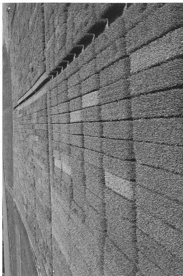
Fig. 3. Pour homologuer une variété, 3 années d'expérimentation en 18 lieux répartis sur toute la Suisse sont nécessaires.