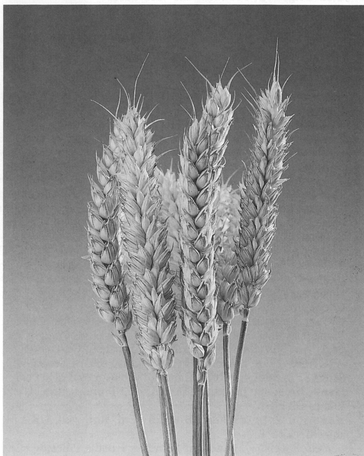
Fig. 1. La dernière variété de l'assortiment des blés d'automne : Ramosa.

dans cette publication donne un aperçu de leurs caractères généraux. La présentation de cette liste officielle est basée sur les principaux résultats des essais d'homologation. Des différences de comportement peuvent survenir suivant les conditions agro-climatiques régionales. Pour la pratique, seule la comparaison directe entre les variétés permet un choix judicieux.