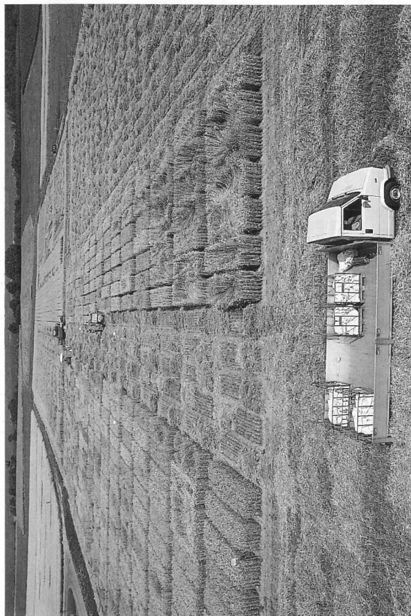
Fig. 2. Avant une homologation, des milliers de parcelles doivent être récoltées.