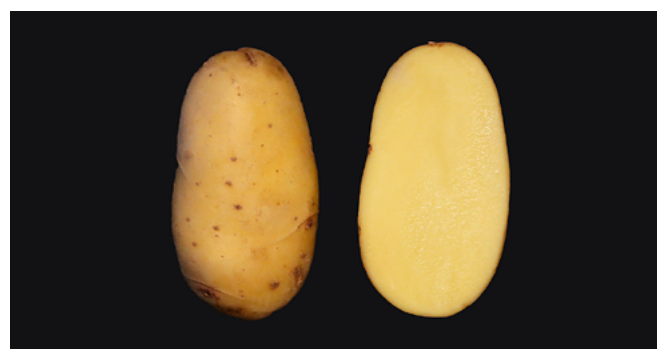
Figure 3 | Sound est une variété de consommation à chair farineuse de type culinaire B-C, de forme oblongue courte et de chair jaune clair avec un bon potentiel de rendement. Elle a été sélectionnée par la société Meijer aux Pays-Bas et présente une bonne résistance au mildiou. Elle est sensible au rhizoctone déformant et au virus Y et Y NTN . Elle est moyennement sensible aux gales.

Une variété peut se situer entre deux types culinaires: la première lettre indique alors le type culinaire prédominant. Par exemple, une pomme de terre de type culinaire B-C est moins farineuse et plus ferme qu'une autre de type C-B.