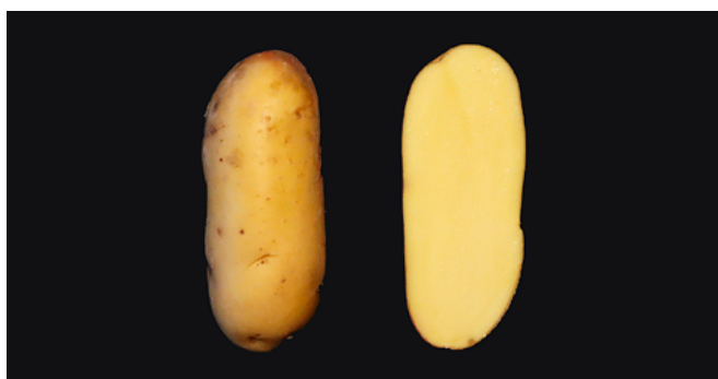
Figure 1 | Lady Jane est une variété frites de type culinaire C sélectionnée par la société Meijer aux Pays-Bas. Elle est de forme oblongue courte et de chair jaune à jaune clair avec un bon potentiel de rendement. Cette variété a une très bonne résistance au mildiou, au rhizoctone et à la gale commune. Elle est sensible à la gale poudreuse et moyennement sensible au virus Y et Y NTN .

Les caractéristiques de 76 variétés sont décrites dans deux tableaux distincts: d'une part une liste principale, où figurent 45 variétés et, d'autre part, une liste secondaire, où sont décrites 31 variétés. Sur la liste principale apparaissent les variétés ayant atteint une certaine importance sur le marché suisse; quant à la liste secondaire, elle contient des variétés dont l'importance commerciale est moindre ainsi que des anciennes variétés. Sur la liste principale, les variétés de consommation sont divisées en cinq groupes: le groupe des variétés de consommation précoces, le groupe des variétés de consommation à chair ferme, le groupe des variétés de consommation à chair farineuse ainsi que les groupes de variétés de transformation industrielle frites et chips. Sur la liste secondaire, toutes les variétés de consommation sont regroupées, mais séparées des variétés destinées à la transformation en frites ou en chips. La variété frites Lady Jane (fig. 1) ainsi que la variété chips mi-précoce Beyonce (fig. 2) ont été nouvellement inscrites sur la liste principale. La variété de consommation à chair ferme Sound (fig. 3) est