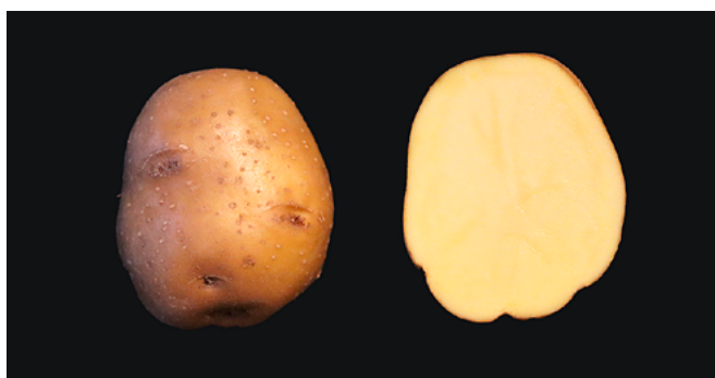
Figure 2 | Beyonce est une variété chips de type culinaire B-C avec un bon rendement. Cette variété mi-précoce a été sélectionnée par la société néerlandaise Agrico. Les tubercules sont ronds à oblongs courts et la chair jaune clair à jaune. Son aptitude à la conservation est plutôt bonne, mais elle n'est pas adaptée à une conservation à froid. Elle présente une très bonne résistance au mildiou et au rhizoctone, toutefois elle est plutôt sensible aux gales, en particulier à la gale poudreuse. Elle est également sensible au virus Y et dans une moindre mesure aux virus Y NTN .

www.agridea.ch | www.swisspatat.ch | www.agroscope.ch