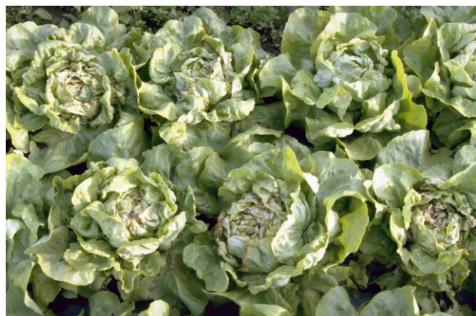
Abb. 2: Übermässig mit Stickstoff versorgte Salatkulturen sind sehr wüchsig und deutlich anfälliger für Innenbrand bzw. Randen.

Im Herbst im Oberboden noch vorhandener Stickstoff (N) wird im Laufe des Winters in tiefere Schichten, ausserhalb der Reichweite der Pflanzenwurzeln, verlagert. In Flächen, auf denen im Herbst noch eine Spätbegrünung steht, wird deutlich weniger Reststickstoff ausgewaschen. Dieser ist jedoch zu einem grossen Teil vorübergehend in der noch nicht abgebauten Pflanzenmasse der Winterbegrünung festgelegt und steht den ersten Kulturen zu Vegetationsbeginn kaum zur Verfügung. Ausserdem setzt die N-Nachlieferung durch Mineralisierung von organischer Bodensubstanz bei den noch tiefen Bodentemperaturen erst verzögert ein. Frühkulturen sind daher auch auf eine bedarfsgerechte N-Zufuhr über die Düngung angewiesen. Anders sieht die Versorgungslage mit Stickstoff bei den im weiteren Jahresverlauf nachgebauten Kulturen aus.