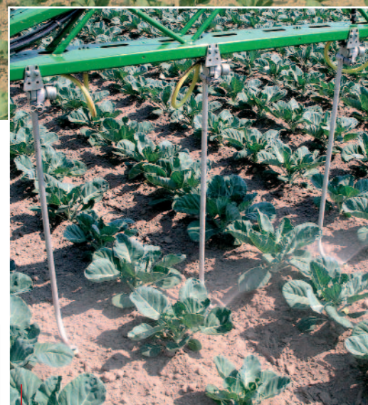
Spritzarbeit mit Spritzbeinen in einem noch jungen Rosenkohlfeld

In mehreren Feldversuchen in Praxisbetrieben wurden so genannte Spritz-