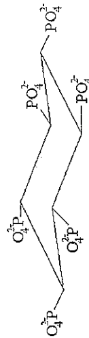
Figure 1: Myo-Inositol Hexakisphosphate