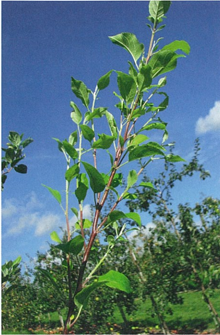
Apfeltriebsucht (Apple proliferation phytoplasma) – Hexenbesen Prolifération du pommier – Balai de sorcière.