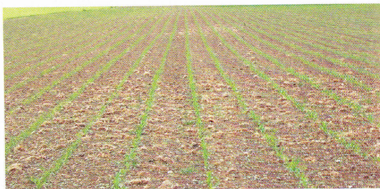
Situation des adventices en mai sur deux parcelles biologiques depuis une longue période (photos prises fin-mai à début juin 2011). Au début juin 2011, les adventices couvraient 9% du sol de la parcelle 1 et 73% de la parcelle 2.

La pression des adventices sur les parcelles PER est généralement très faible, du fait de l'utilisation d'herbicides. Peu de temps après le passage à l'agriculture biologique, la pression des adventices augmente fortement et les mauvaises herbes problématiques représentent en moyenne 30 à 50% de la couverture adventive totale. La couverture du sol est la même sur les parcelles en reconversion que sur les «jeunes» ou