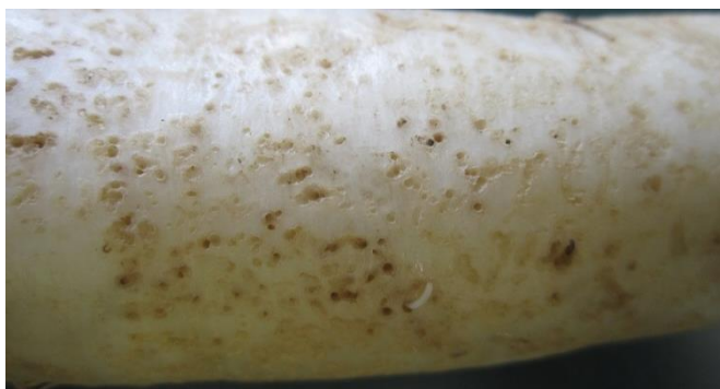
Foto 5: danni nutrizionali superficiali su ramolaccio causati dalle larve delle altiche.