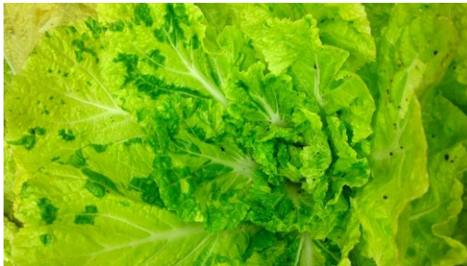
Foto 6: Turnip Yellow Mosaic Virus (TuYMV) su cavolo cinese.

E' stato inoltre provato che le altiche possono trasmettere il Turnip yellow mosaic virus (TuYMV) e il Radish mosaic virus (RaMV). Le piante ospiti del virus TuYM appartengono alla famiglia delle crocifere. Piante infestate da TuYM sviluppano inizialmente una colorazione gialla lungo le venature delle foglie che successivamente diventano delle macchie giallo chiare che si uniscono (foto 6). Un'infezione da RaMV può causare disturbi di crescita nelle giovani piante, mentre nelle piante più sviluppate non causa alcun danno evidente.