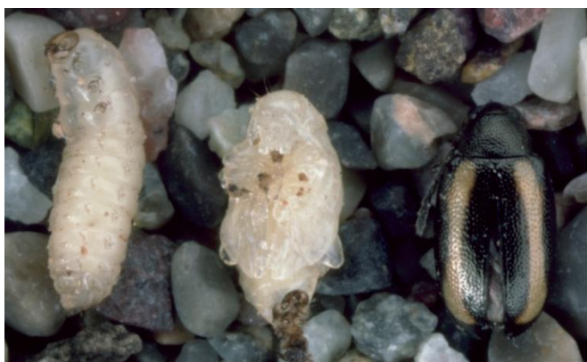
Foto 3: larve, pupa e coleottero adulto altica.

L'attività nutrizionale sotterranea passa spesso inosservata. Raramente si osservano danni radicali, p.es., su ramolaccio, rapanello e cavolo cinese. (foto 5).