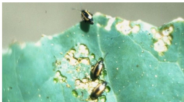
Foto 1: erosione a finestra dei lembi fogliari causati dall'altica del cavolo Phyllotreta nemorum (foto: Agroscope).

Le altiche appaiono precocemente in primavera e iniziano la loro attività nutrizionale sulle parti vegetali aeree. Poiché le giovani piantine reagiscono in modo marcato a quest'attività possono crearsi importanti danni economici.