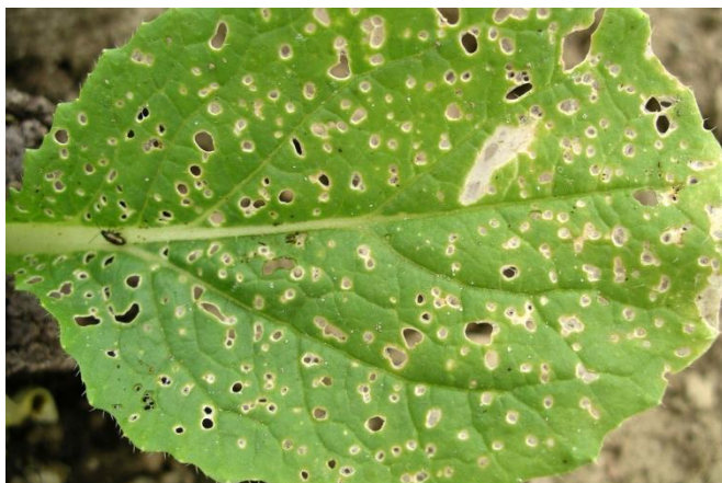
Foto 4: fori causati dall'attività nutrizionale delle altiche su foglie di cavolo cinese.