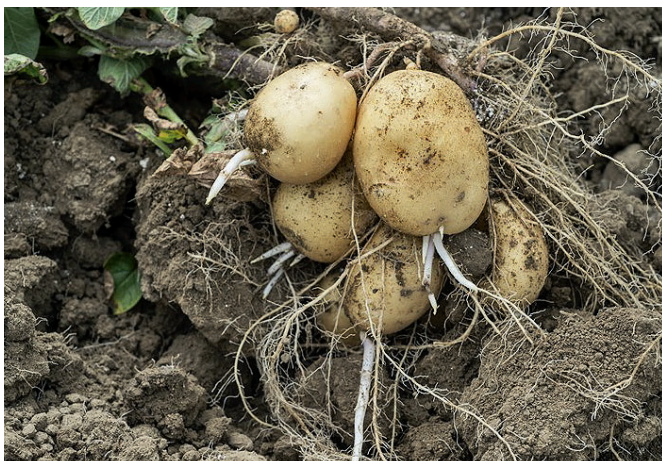
Figure 3 | Regermage dans le sol fin juillet 2015 sur Markies à Goumoëns-la-Ville.