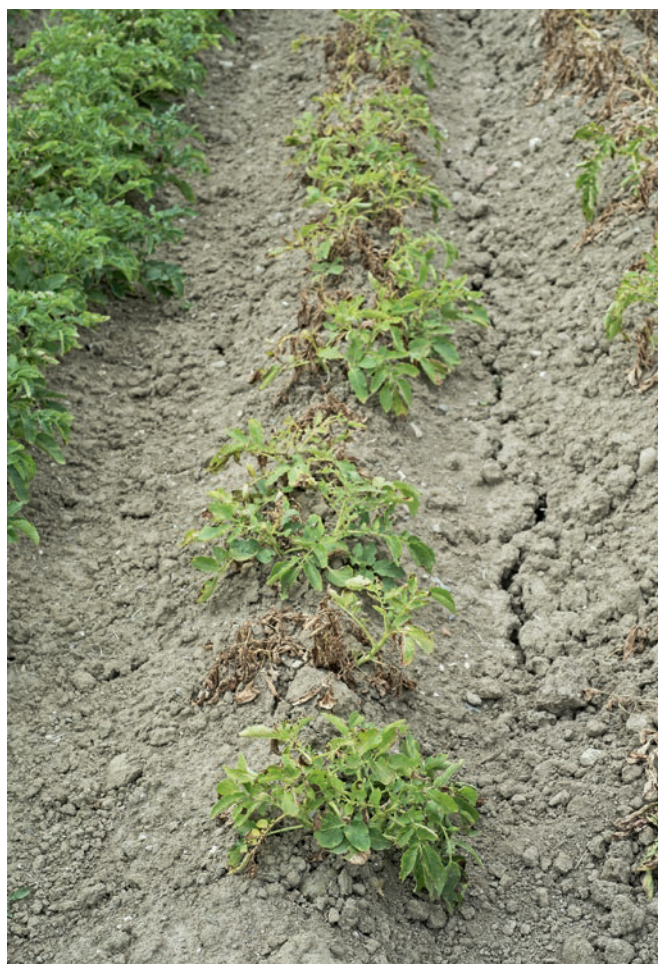
Figure 4 | La variété Charlotte, qui souffre de la sécheresse, meurt rapidement. Une attaque par l'alternariose ( Alternaria solani ), la dartrose ( Colletotrichum coccodes ) ou la verticilliose ( Verticillium spp.) en fin de végétation peut accélérer la sénescence en périodes sèches et chaudes.