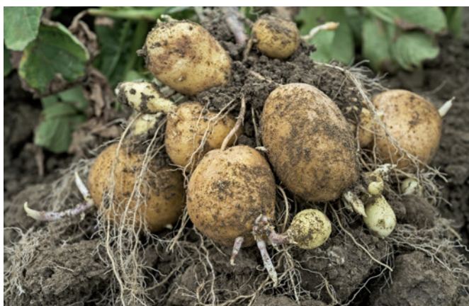
Figure 2 | Formation d'une deuxième génération de tubercules fin juillet 2015 sur Agria à Goumoëns-la-Ville.

Les variétés Bintje et Agria ont créé une deuxième génération de tubercules (fig. 2). Les variétés Désirée, Amandine, Markies, Annabelle, Ditta, Lady Felicia et Verdi ont fortement regermé dans le sol (fig. 3) et ont parfois également créé une deuxième génération. Les variétés qui réagissent ainsi, perdent leur consistance et leur qualité se détériore clairement.