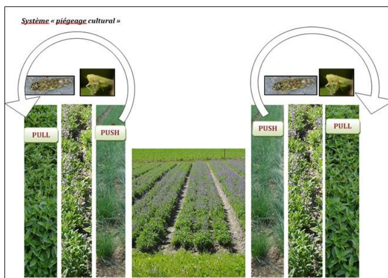
«Push & Pull»-Strategie beim «Fallen-Kulturen»-System.

- Ein «Fallen-Kulturen»-System, bei dem ein Salbei-Beet «geopfert» wird, um die Zikaden zwischen einem Minzen- und Schnittlauchbeet «einzuschliessen». Dieses System ist sowohl wirtschaftlich als auch organisatorisch vorteilhafter als das Mischkulturen-System und lässt sich zweifellos schneller einrichten. Die Minzen-Beete befinden sich bei beiden Systemen am Rand der Kulturen, sind aber geschickt zu bewirtschaften, um ihre Anziehungskraft zu fördern. Sicherlich sind gestaffelte Schnitte wirksam, um eine kontinuierliche Erneuerung der Minzeblätter zu erreichen und den Zikaden Nahrung und Habitate bieten zu können.