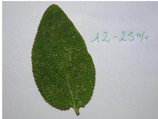
Schätzungen der durch Zikaden verursachten Schäden auf Salbeiblättern

Bei einer Massenvermehrung verursachen diese Zikaden Entwicklungsstörungen bei den befallenen Pflanzen und bedeutende wirtschaftliche Verluste, insbesondere für Produzenten von Frischpflanzen, die makellos aussehen müssen. Die Symptome bestehen aus einer leichten Schwellung der Blätter, mit verstreuten weisslichen bis gelben Verfärbungen (Chlorosen).