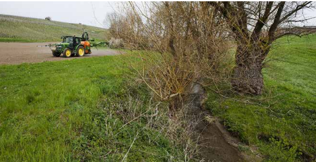
Kleine Fliessgewässer werden häufig durch Pflanzenschutzmitteleinträge belastet.

Auskünfte: Volker Prasuhn, E-Mail: volker.prasuhn@agroscope.admin.ch