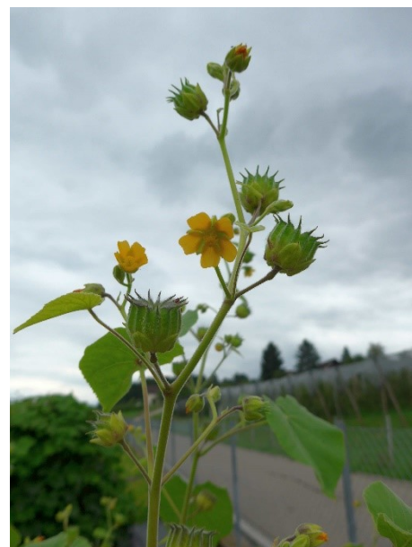
Photo 2: Inflorescences et fructifications de l'abutilon à fleurs jaunes.

Dans ce cas comme dans d'autres, respectez la règle : agir dès les premiers soupçons de présence !