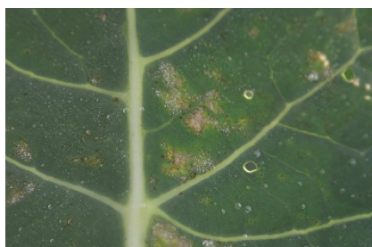
Photo 4: Le mildiou ( Peronospora parasitica ) infeste fortement les cultures de brassicacées et tend à sporuler aussi à la face supérieure des feuilles.