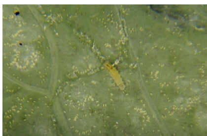
Photo 3: La mouche blanche ( Aleyrodes proletella ) est en pleine activité de ponte sur les choux. Les premières larves de syrphes ( E. balteatus et autres) apparaissent actuellement et se nourrissent des pontes.