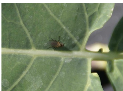
Photo 9: Mouche du chou ( Delia radicum ) sur une feuille de colrave.