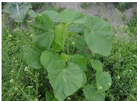
Photo 1. Un abutilon à fleurs jaunes avec sa première fleur (photo de R. Total, Agroscope, datée du 11 juin 218).

La floraison de l'abutilon à fleurs jaunes a commencé. Originaire d'Asie, cette plante a un aspect particulier. Ses feuilles sont duvetées et de forme semblable à celles du tilleul. Les fleurs sont jaune-orange et les fruits sont des capsules anguleuses contenant les graines (photos 1+2). Chaque plante produit jusqu'à 1'700 graines, qui, dans le sol, gardent une capacité germinative allant jusqu'à 50 ans. Il est donc crucial d'éliminer les plantes avant la maturation de leurs graines, et de les évacuer avec les ordures à incinérer.