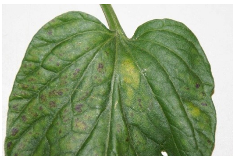
Photo 13: Attaque de tétranyques sur une feuille de tomate âgée. Le dessus de la feuille jaunit à l'emplacement de l'attaque, qui, elle, se produit sur la face inférieure.

Lors de vos tournées de contrôle, marquez les foyers d'infestation. Une mesure d'urgence sous abris consiste à concentrer dans ces foyers des sachets d'acariens prédateurs ( Amblyseius ) ; commandez immédiatement ces auxiliaires ou, si nécessaire, traitez les foyers.