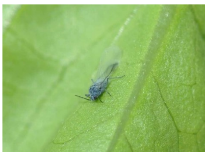
Photo 6: Le vol d'invasion du puceron des racines de la laitue ( Pemphigus bursarius ) a commencé. Il est recommandé de protéger les cultures sensibles situées dans les régions menacées.