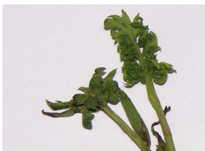
Photo 7: Dans les régions où les attaques du psylle de la carotte ( Trioza apicalis ) sont fréquentes, il faut surveiller dès maintenant l'occurrence de déformations du feuillage. Si l'on peut exclure que les pucerons soient responsables des dégâts (présence d'individus vivants ou d'exuvies), alors ces derniers sont attribuables à une attaque de psylles de la carotte.