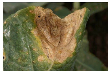
Photo 5: Il faut s'attendre dès maintenant à l'apparition de la maladie des nervures noires ( Xanthomonas campestris ) dans les cultures de choux.