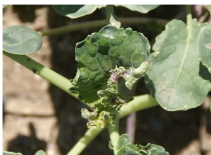
Photo 10: Le puceron cendré du chou ( Brevicoryne brassicae ) occasionne d'importants dégâts lorsqu'il s'attaque au cœur des plantes.

Dans les cultures de longue durée, comme les choux de Bruxelles, il est recommandé de réserver un premier traitement au diméthoate à l'époque du pic de vol annoncé pour fin juin/début juillet. Les deuxièmes et troisièmes traitements au diméthoate seront si possibles réservés aux mois d'août et de septembre, pour lutter contre les larves issues du 3 ème vol de la mouche du chou. On peut en effet s'attendre à une longue durée de l'activité automnale du ravageur.