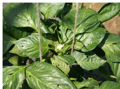
Photo 8: On observe maintenant l'apparition de jeunes larves de noctuelles sur les légumes fruits cultivés sous verre. Sur poivrons, les dégâts causés par les morsures se traduisent par de nombreux trous ronds aux bords francs. Contrôlez vos cultures et faites un traitement en cas de nécessité.