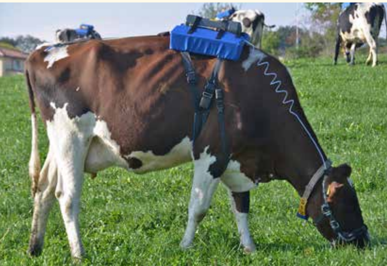
Figure 1 | Vache laitière équipée avec le système de collecte continue de l'air expiré pour en déterminer ensuite la concentration en méthane et en gaz traceur (hexafluorure de soufre ou SF 6 ).

Renseignements: Andreas Münger, e-mail: andreas.muenger@agroscope.admin.ch