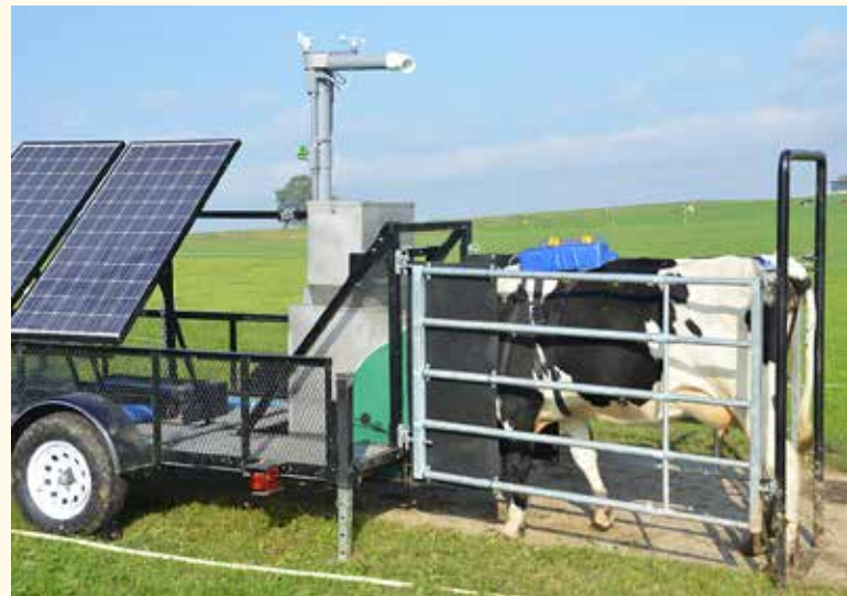
Figure 2 | Une vache laitière est entrée dans le système de mesure GreenFeed, permettant la mesure ponctuelle des émissions de méthane.