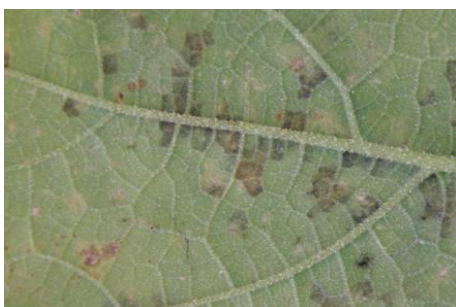
Photo 15: À la face inférieure des feuilles, les plages attaquées par le pathogène se couvrent d'un feutrage gris-violet abritant les spores du pathogène.

En raison de l'augmentation de la pression d'infection, on utilise surtout des fongicides (partiellement) systémiques ou translaminaires, pénétrant les tissus foliaires, par exemple : fosétyl-aluminium (Alial 80 WG, Alfil WG, Aliette WG, autorisé sur concombres, courges comestibles et courgettes (délai d'attente 3 jours); fosétyl-aluminium + fénamidon (Verita, autorisé sur concombres et courgettes (délai d'attente 3 jours), sur courges comestibles (délai d'attente 1 semaine), cyazofamide (Ranman, Ranman Top ; autorisé sur concombres, courges comestibles et courgettes, délai d'attente 3 jours); diméthomorphe (Forum, autorisé sur concombres, délai d'attente 3 jours), hydrochlorure de propamocarbe + fénamidon (Arkaban, Consento, autorisé sur concombres, courges comestibles et courgettes, délai d'attente 3 jours); hydrochlorure de propamocarbe (Proplant, autorisé sur concombres et courgettes, délai d'attente 5 jours); propamocarbe + fosétyl (Previcur Energy, autorisé sur concombres, délai d'attente 5 jours).