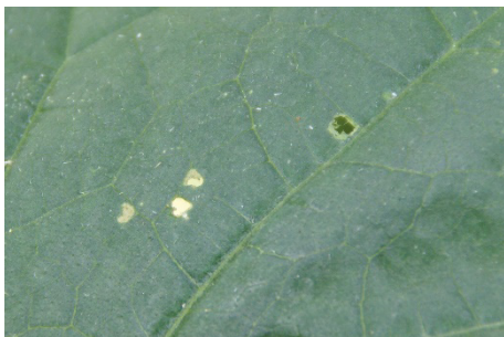
Photo 13: Petites perforations causées par les morsures de jeunes chenilles de noctuelles ( Noctuidae ) sur une feuille de concombre.