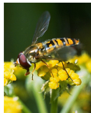
Photo 10: On observe actuellement, dans les cultures de légumes, une forte activité d'adultes de mouches syrphides à larves aphidiphages (ici un imago du syrphide ceinturé, Episyrphus balteatus ).