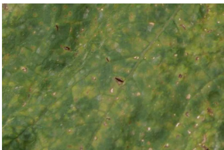
Photo 14: Taches foliaires causées par le mildiou des cucurbitacées à la face supérieure d'une feuille de courge.

Pour lutter contre les chenilles de noctuelles ( Noctuidae ) sur aubergines, concombres, poivrons et tomates en serres, sont autorisés Bacillus thuringiensis var. aizawai (XenTari WG), Bacillus thuringiensis var. kurstaki (Dipel DF), spinosad (AudiENZ, BIOHOP AudiENZ, Perfetto) et zéta-cyperméthrine (ArboRondo ZC 1000, Fury 10 EW) avec un délai d'attente de 3 jours. Est autorisé aussi sur aubergines, poivrons et tomates : chlorpyrifos-méthyl (Pyrinex M22, Reldan 22, délai d'attente: 3 Tage). Sur concombres , on peut utiliser contre les chenilles de noctuelles le benzoate d'émamectine (Affirm, Affirm Profi, Rapid) et le méthomyl (Lannate 25 WP, Méthomyl 25 WP) avec un délai d'attente de 3 jours.