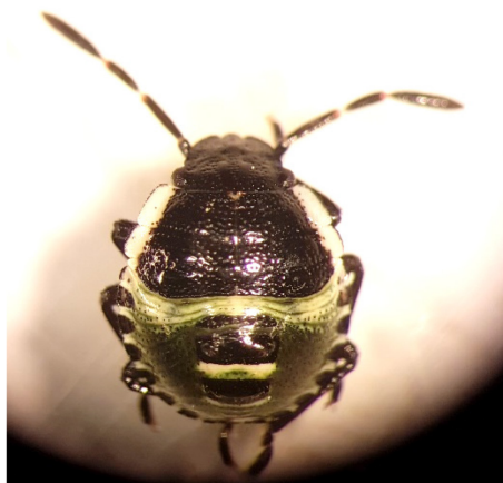
Photo 1: Le 2 ème stade nymphal («larvaire») de la punaise verte est caractérisé par un abdomen verdâtre alors que le 1 er stade est rougeâtre.

Lundi, nous avons constaté dans une serre de tomates des dégâts de succion causés par de jeunes adultes de la punaise verte indigène ( Palomena prasina ).