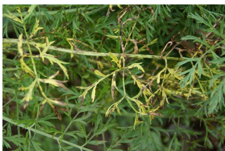
Photo 11: Feuillage d'une culture de carottes atteint de maladies à taches foliaires ( Alternaria dauci , Cercospora carotae ) (photo: C. Sauer, Agroscope).