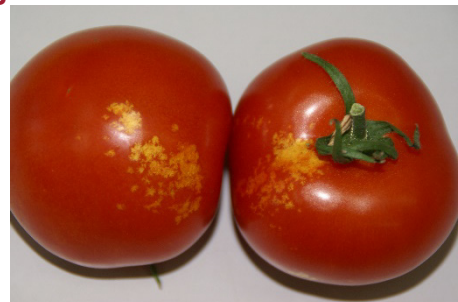
Photo 2: Dégâts de succion de larves de Palomena sur fruits de tomate.

Comme d'autres cultures de serre ont été colonisées par la punaise verte au cours des dernières semaines, nous devons admettre qu'elle peut occasionnellement causer des dégâts aux légumes fruits sous verre. Vous trouverez d'autres photos à la première page de l'Info Cultures maraîchères 15/2019 du 19 juin 2019.