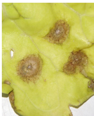
Photo 8: Une recrudescence de maladies à taches foliaires, causées p.ex. par Alternaria spp. et Cercospora beticola , est observée actuellement sur les bettes.