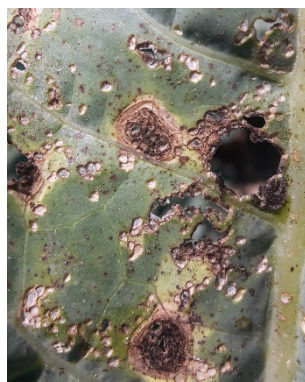
Photo 4: Sous les filets de protection, la maladie des taches noires du chou ( Alternaria brassicae ) peut s'avérer virulente sur brocolis.