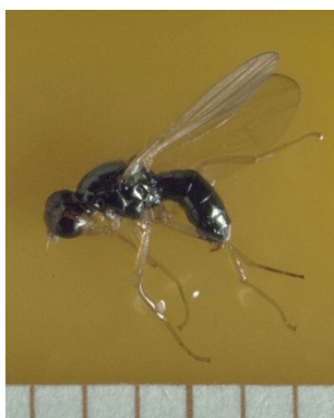
Photo 7: Le vol de la 2 ème génération de la mouche de la carotte ( Psila rosae ) a commencé à certains endroits dans les régions précoces.