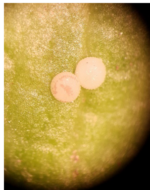
Photo 5: Les premiers œufs de noctuelles ( Noctuidae ) ont été découverts lundi sur salades. Il est important de contrôler les cultures !