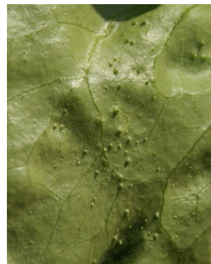
Photo 6: Les salades proches de la récolte montrent souvent de telles pustules à la face inférieure des feuilles, sans doute dues à un excès de pression hydrique.