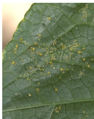
Photo 9: Les populations de pucerons se reconstituent dans diverses cultures. Sur cucurbitacées, il s'agit souvent du puceron du melon et du cotonnier ( Aphis gossypii ), ou d'espèces très voisines, comme Aphis nasturtii.