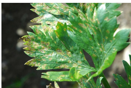
Photo 12: Taches foliaires dues à la septoriose ( Septoria apicola ) sur le feuillage d'un céleri pomme.

Il est recommandé de contrôler ces cultures. Pour lutter contre Alternaria dauci sur carottes, sont autorisés avec un délai d'attente de trois semaines : les préparations de cuivre (divers produits), les fongicides de contact chlorothalonil (divers), iprodione (divers), mancozèbe (divers) ainsi que les préparations combinées chlorothalonil + azoxystrobine (Ortiva Opti), tébuconazole + trifloxystrobine (Nativo) et les inhibiteurs de la synthèse des stéroïdes tébuconazole (Ethosan, Fezan). Le délai d'attente est de deux semaines pour azoxystrobine (divers produits), azoxystrobine + diféconazole (Priori Top), boscalid + pyraclostrobine (Signum), diféconazole (divers) et tébuconazole + fluopyrame (Moon Experience) et trifloxystrobine + fluopyrame (Moon Sensation). Trifloxystrobine (Flint, Tega) et fluxapyroxad + difénoconazole (Dagonis) sont autorisée avec un délai d'attente d'une semaine. Partiellement efficace, Bacillus subtilis (Serenade ASO) est aussi autorisé contre l'alternariose de la carotte.