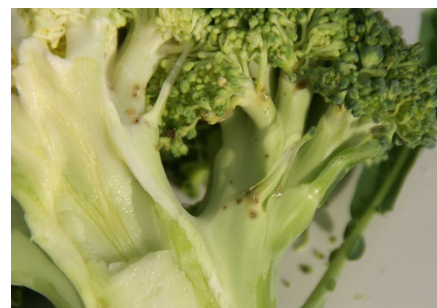
Photo 3: Traces brunes de nombreuses piqûres de charançons de la tige du chou sur les pédoncules, sous les boutons floraux.