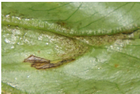
Photo 16: Traces de succion argentées brillantes et crottes noires de thrips sur une salade iceberg.