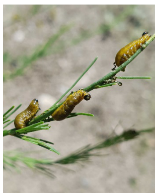
Photo 12: Des adultes et larves de diverses espèces de criocères de l'asperge ( Crioceris spp.) envahissent actuellement les cultures d'asperges.