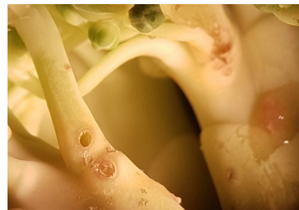
Photo 6: Traces de piqûres et subérifications sur un pédoncule floral (photo Agroscope prise sous binoculaire).

Dans les régions de culture de colza, les cultures de chou devraient être immédiatement traitées avec un des pyréthrinoïdes autorisés, ou protégées par un filet de couverture. Il y a encore des larves de charançons de la tige du chou sur les pédoncules floraux et les tiges des brassicacées maraîchères. Il faut donc s'attendre à la poursuite de l'éclosion de jeunes adultes.