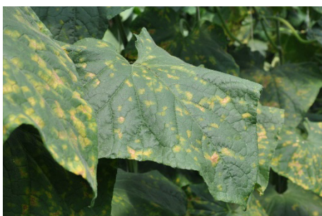
Photo 18: Taches jaunes anguleuses du mildiou à la face supérieure de feuilles de concombre.