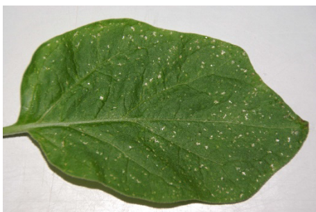
Photo 17: On voit de plus en plus de traces de succion blanches argentées laissées par les thrips dans les cultures de légumes fruits sous serres, par exemple sur les aubergines.