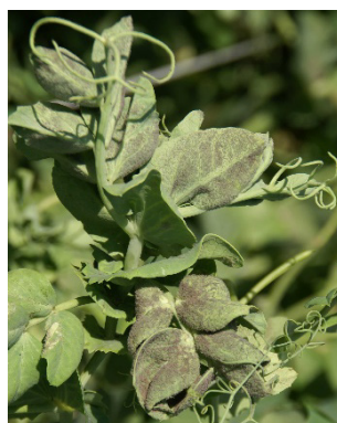
Photo 13: Lors du contrôle de lundi, nous avons constaté sur pois une très forte attaque de mildiou ( Peronospora viciae f.sp. psii ).