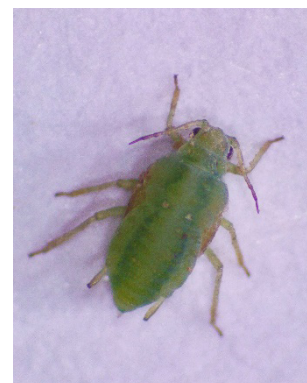
Photo 10: Le CtRLV a pour vecteur le puceron du saule ( Cavariella aegopodii ).