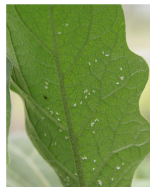
Photo 14: Dans les cultures de légumes fruits sous verre, vérifiez l'activité des auxiliaires, en particulier de ceux actifs contre la mouche blanche ( Trialeurodes vaporariorum ).