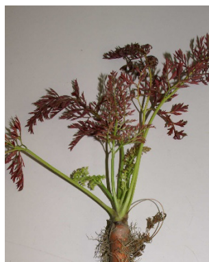
Photo 9: Chez les carottes, un port rétréci, des feuilles du cœur déformées et un feuillage rougeâtre sont des symptômes du Carrot red leaf virus (CtRLV).