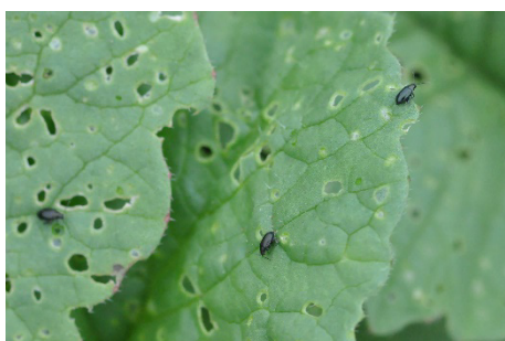
Photo 15: Les jeunes cultures de choux réagissent de manière particulièrement sensible aux altises du chou.