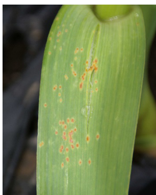
Photo 11: Les sporanges de la rouille ( Puccinia porri ), de couleur orange, sont maintenant bien visibles sur le feuillage de l'ail.