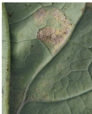
Photo 8: On constate particulièrement sur brocolis une forte pression d'infection du mildiou ( Peronospora parasitica ).