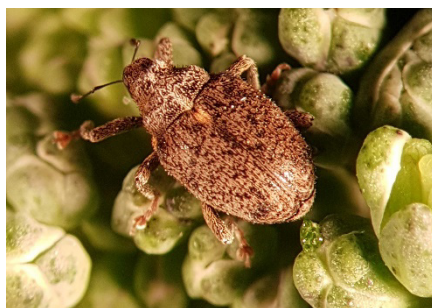
Photo 2: Dans la culture concernée, on a trouvé au moins 8-10 charançons de la tige du chou par inflorescence (photo: Agroscope prise sous binoculaire).