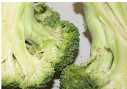
Photo 4: Il y a aussi de nombreuses subérifications attribuables également aux charançons.