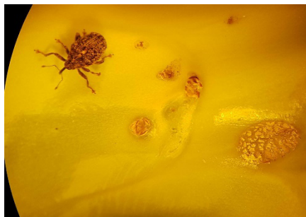
Photo 5: Charançon de la tige du chou avec les dégâts causés sur un pédoncule floral de brocoli (photo Agroscope prise sous binoculaire).