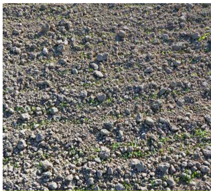
La mise en place d'une prairie nécessite un lit de semences assez fin avec des petites mottes en surface et une structure de bonne portance en profondeur.

Face au réchauffement climatique, semer une prairie en plein été est aujourd'hui associé à un risque considérable. Le choix du bon moment peut fortement influencer le résultat. Pour la mise en place d'une prairie de longue durée, la fin de l'été est en général la période la plus propice. On évite ainsi les grosses chaleurs et les risques de sécheresse de