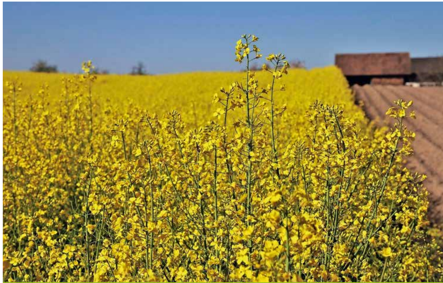
La demande en huile de colza reste élevée cette année encore.

La demande en huile de colza reste élevée cette année encore, en raison du remplacement de l'huile de palme par de l'huile de colza dans certaines industries agroalimentaires. Ainsi, chaque producteur s'est vu attribuer la quantité souhaitée pour la récolte 2021. Les nouveaux producteurs ont également pu être pris en compte pour les attributions. Jusqu'à maintenant, 93 000 tonnes de colza ont été annoncées. La quantité cible de 106 000 tonnes