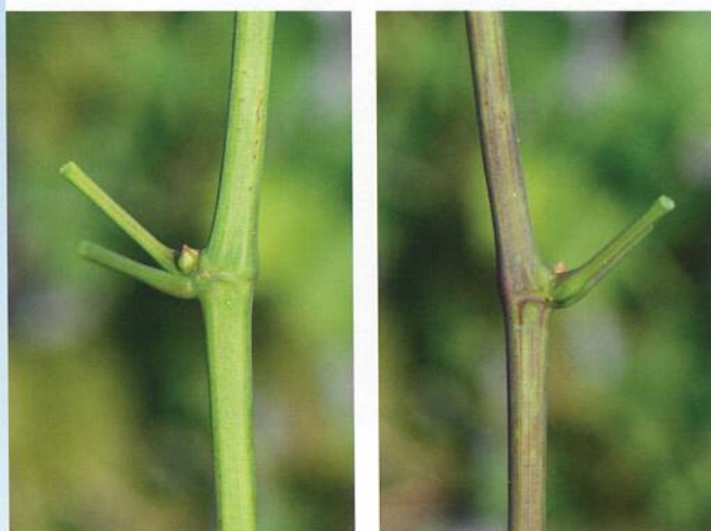
Rameau herbacé face ventrale (à gauche) et dorsale (à droite).