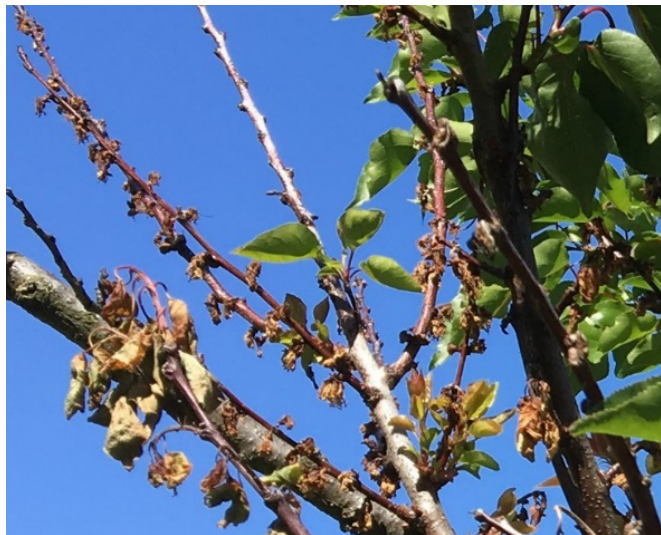
Figure 1 : Fleurs et rameaux atteints de moniliose

Les champignons développés sur les fleurs et les nécroses peuvent atteindre les fruits plus tard dans la saison. Si les fruits infectés ne sont pas récoltés, ils se dessèchent, se momifient et constituent une source d'infection pour l'année suivante. À côté des fruits momifiés, les champignons qui hibernent sur les nécroses et les rameaux infectés sont également une source d'infection s'ils ne sont pas éliminés à l'automne.