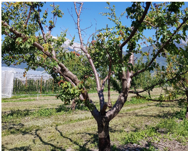
Figure 3 : Dégâts de bactériose