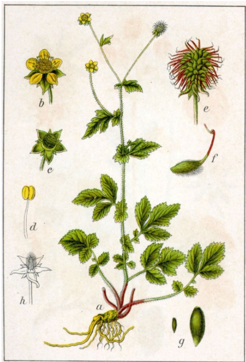
Abbildung 1: Echte Nelkenwurz ( Geum urbanum L.). Deutschlands Flora in Abbildungen, 1796 (Illustration: Jacob Sturm)

Die Echte Nelkenwurz oder Gemeine Nelkenwurz ( Geum urbanum L.) trägt auch den Volksnamen «Benediktinerkraut» (Abbildung 1). Sie gehört zur Familie der Rosengewächse ( Rosaceae ). Diese einheimische, ausdauernde Art gehört zu den Hemikryptophyten und wächst an kühlen, schattigen und humosen Standorten. In der Schweiz ist sie häufig in nährstoffreichen Krautsäumen (Schuttplätze, Hecken, Unterholz usw.) der kollinen bis submontanen Stufe anzutreffen.