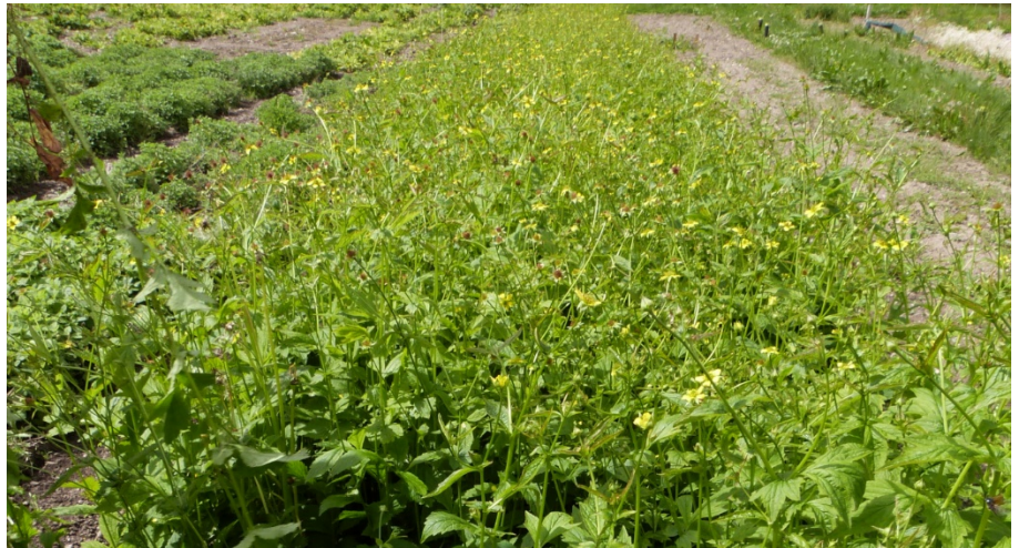
Kultur der Echten Nelkenwurz ( Geum urbanum L.) in Bruson (VS), 1050 m.ü.M.