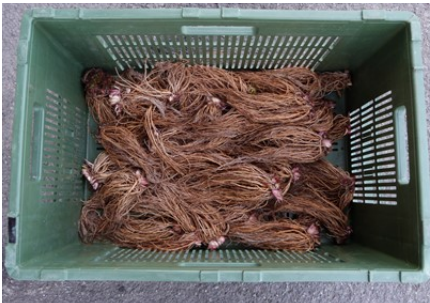
Abbildung 2: Gewaschene frische Wurzeln der Echten Nelkenwurz.

Die oberirdischen, behaarten Stängel erreichen eine Höhe von 50 bis 90 cm. Die langgestielten, grundständigen Blätter sind unpaarig gefiedert, wobei sich grosse Fiederblättchen mit kleinen abwechseln . Die grosse Endfieder ist meist dreilappig und grob gezähnt. Auch die Stängelblätter sind meist dreilappig. Die Echte Nelkenwurz blüht von Mai bis August mit kleinen, gelben, aufrechten Blüten mit einem Durchmesser von 1 bis 2 cm. Die Früchte – Nüsschen mit Haken (Epizoochorie) – sind zu einem sitzenden Kopf zusammengesetzt (Lauber et al., 2018). Die rhizomartigen, faserigen und fleischigen Wurzeln (Abbildung 2) entwickeln bei Verletzung Eugenol und verströmen einen angenehmen Nelkengeruch.