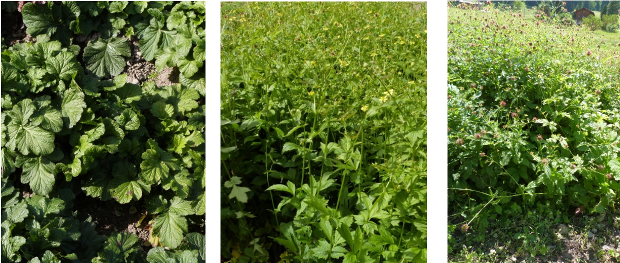
Abbildung 3: Phänologische Stadien der Echten Nelkenwurz bei den Ernten. Links: Ernte im Herbst des ersten Anbaujahres. Stadium Blätter (BBCH 40-45). Mitte: Ernte im Sommer des zweiten Anbaujahres. Stadium Blüte (BBCH 63-69). Rechts: Ernte im Herbst des zweiten Anbaujahres. Stadium Fruchtbildung (BBCH 75-80).

Die Kultivierung der Echten Nelkenwurz ist relativ einfach, auch im biologischen Anbau und in Bergregionen. Die Pflanzen wachsen schnell und können sich im Konkurrenzkampf mit Unkräutern gut behaupten. Bereits im ersten Anbaujahr wird der Boden effektiv gedeckt. Im zweiten Anbaujahr erreichten die Pflanzen im Juli eine Höhe von 80–90 cm (Abbildung 3). Bei diesem Versuch wurde im ersten Anbaujahr drei Mal von Hand gejätet. Im zweiten Jahr erfolgte nur eine mechanische Unkrautbekämpfung zu Beginn der Vegetationsperiode.