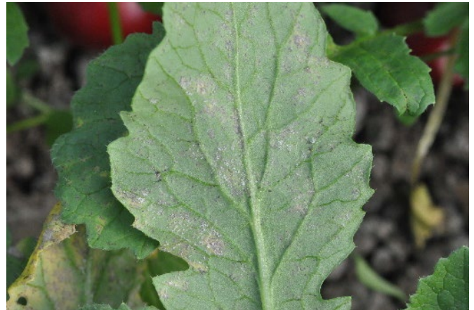
Abb. 7: Falscher Mehltau auf der Unterseite eines Radies-Blattes.