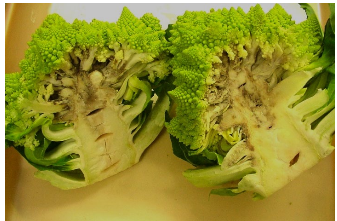
Abb. 5: Falscher Mehltau in Blume und Strunk von Romanesco mit den typischen gräulich-schwarzen Flecken und Strichen (Foto: H.P. Buser, Agroscope).