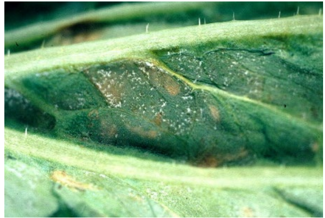
Abb. 11: Symptome des Falschen Mehltaus an Chinakohl.