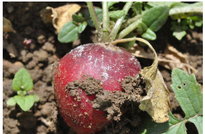
Abb. 9: Bei starkem Befallsdruck wird der weissgraue Sporenrasen des Falschen Mehltaus auf der Radiesknolle sichtbar.