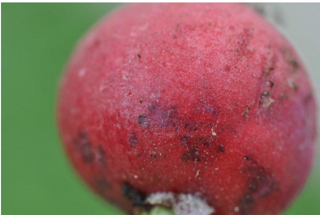
Abb. 8: Schwarze Flecken an einer Radiesknolle durch Befall von Falschem Mehltau (Foto: Agroscope).