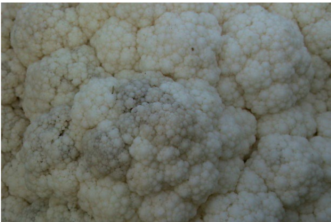
Abb. 4: Infektion mit Falschem Mehltau auf einem Blumenkohl.