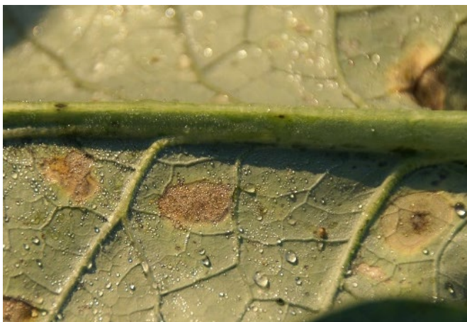
Abb. 1: Unter der Hauptader links zwei Flecken des Falschen Mehltaus, rechts ein Flecken der Kohlschwärze auf der Unterseite eines Broccoliblattes.

Hauptsächlich zeigen Blätter und Blumen Symptome, grundsätzlich können aber alle oberirdischen Teile infiziert werden. Ein sicheres Zeichen für den Befall mit Falschem Mehltau ist das Wachstum eines grauen Sporenrasens auf der Blattunterseite. Feuchte Bedingungen fördern die Entstehung dieses Sporenrasens. Sekundär können sich Weichfäulebakterien wie Erwinia spp. auf den Läsionen entwickeln. Gelegentlich kommt der Falsche Mehltau auch zusammen mit anderen Krankheitserregern, zum Beispiel der Kohlschwärze ( Alternaria brassicae , A. brassicicola ) (Abb. 1), oder Schimmelpilzen wie Rhizopus spp. vor. Ältere Kulturstadien werden lediglich geschwächt. Der Ertrag sinkt und die Qualität leidet. 1