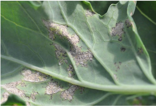
Abb. 10: Sporenrasen des Falschen Mehltaus an der Unterseite eines Kohlrabiblattes.

Eine Infektion von Kohlrabi-Jungpflanzen unter Glas oder Folie sowie im Tunnelanbau kann grosse wirtschaftliche Schäden zur Folge haben. Abbildung 10 zeigt die typischen Symptome. Bei Chinakohl äussern sich Infektionen mit Falschem Mehltau als unscharf begrenzte, braune Blattflecken mit geringer Sporulation (Abb. 11). 2