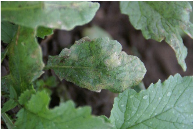
Abb. 6: Falscher Mehltau am Laub von Radies.

Radieschen sind anfälliger für den Falschen Mehltau als Rettich. Auch zwischen den Sorten bestehen Unterschiede. Werden mehrfach Radieskulturen nacheinander angebaut, erhöht sich die Populationsdichte des Erregers und die Gefahr von Frühinfektionen steigt. Auf den (Keim)blättern entstehen gelbliche bis bräunliche Flecken, teilweise mit einem feinen, schwarzen Rand (Abb. 6). Die Symptome auf Rucolablättern sind vergleichbar. Längere feuchte Phasen, denen Herbst- und Winterkulturen verstärkt ausgesetzt sind, fördern die Bildung weisslicher Sporenrasen auf der Blattunterseite (Abb. 7). Am Radieschen selbst entwickeln sich vor allem oben, raue, schwarze Stellen 3 (Abb. 8) und bei starkem Befallsdruck wird auch der weissgraue Sporenrasen sichtbar (Abb. 9). Die Radieschen bleiben fest, verfärben sich im Innern aber grauschwarz. 1 Teilweise entwickeln sich die Symptome auch bei bereits abgepackter Ware nachträglich noch. 3 Gelagerte Speiserüben entwickeln hellbraune bis schwarze Zonen ausgehend vom Rübenscheitel. Zu Beginn noch fest, sind sie zum Faulen prädestiniert. 1