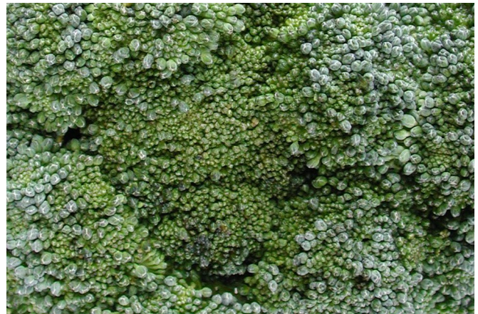
Abb. 3: Brocoliblume mit Symptomen von Falschem Mehltau. Diese sind leicht verwechselbar mit Alternaria -Befall.