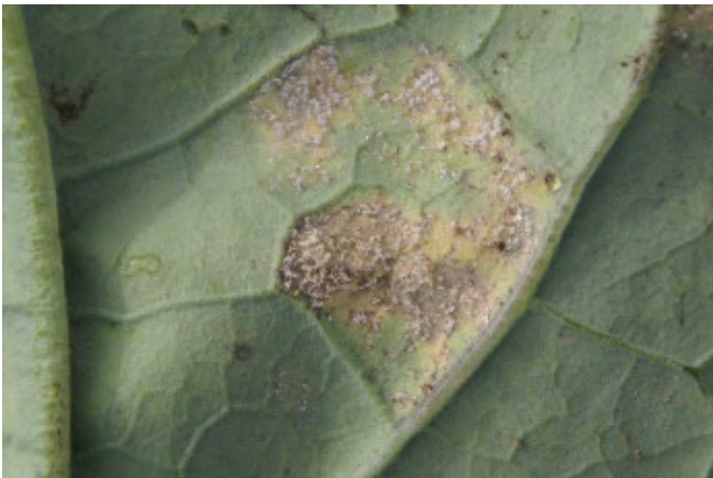
Abb. 2: Von Falschem Mehltau befallenes Brocoliblatt (Foto: Agroscope).

Vor allem in warmen Wintern in nicht gekühlten Lagern kann der Falsche Mehltau bei Kopfkohl auch zu Lagerfäule führen. Diese äussert sich in kleinen schwarzen Punkten im Bereich der Leitungsbahnen, unter Umständen auch in schwarzen Streifen in den Hauptadern bis hinauf in die Blattspitzen. Schlimmstenfalls ist die gesamte Blattspreite von einem Netz schwarzer Punkte durchzogen. 3 Gelegentlich werden die typischen Symptome erst am Verkaufspunkt sichtbar.