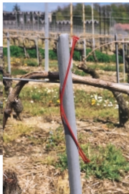
Fig. 1. Les diffuseurs Isonet-LE sont constitués de deux tubes en plastique rouge-brun soudés par leurs extrémités, à fixer sur les sarments (à gauche) ou sur les tuteurs (à droite).