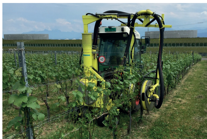
FIGURE 1. Effeuilleuse à double flux d'air (Collard, Bouzy, France) en action avant floraison (vitesse de 0,6 km/h). Gamay, Nyon, Suisse.

L'essai a été mené de 2016 à 2020 dans le vignoble expérimental de Agroscope à Nyon, en Suisse (46°23'52.4»N 6°13'48.7»E) sur les cultivars Doral et Gamay (plantés en 2003 et 2007 respectivement). Pour chaque cultivar, trois traitements ont été appliqués : 1) effeuillage mécanique après nouaison, 2) effeuillage manuel avant floraison et 3) effeuillage mécanique avant floraison. L'effeuillage manuel de la zone des grappes consistait à enlever à la main les six premières feuilles de la base de chaque rameau, y compris les entre-coeurs. L'effeuillage mécanique de la zone équivalente a consisté à utiliser un effeuilleur à air comprimé monté sur un tracteur (E 3000 3P, 2003 ; Collard, Bouzy, France), avec des vitesses différentes pour les traitements avant la floraison et après la nouaison. La vitesse du tracteur était plus faible pour l'effeuillage préfloral (0,6 km/h) en raison de la plus petite surface foliaire à ce stade précoce (Figure 1). Des mesures sur le terrain et des analyses de feuilles et de raisins ont été réalisées. L'éclaircissage des grappes a été réalisé pour chaque traitement en une seule fois avant la fermeture des grappes afin de respecter les quotas régionaux et d'obtenir des rendements comparables pour chaque traitement ; des vins ont été élaborés pour chaque traitement et dégustés par un panel expert. Le matériel et les méthodes complets sont publiés dans OENO One 57(2) 3 .