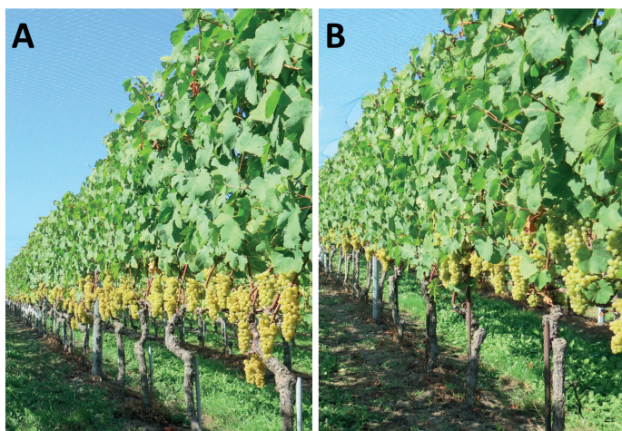
FIGURE 3. Effeuillage manuel (A) et mécanique (B) avant floraison. Doral juste avant la récolte, Nyon, Suisse. Dans le cas de l'effeuillage mécanique, les pousses latérales se sont développées par la suite et ont couvert partiellement la zone des grappes, alors qu'elles ont été complètement éliminées dans le cas de l'effeuillage manuel.

Lorsqu'on les compare deux à deux, aucune différence n'a été observée entre les vins de Doral en termes d'analyse sensorielle, tandis que les vins de Gamay issus de l'effeuillage mécanique avaient tendance à être légèrement moins amers (-7 %) avec des tanins plus doux (+6 %) que les vins issus de l'effeuillage manuel (p-values < 0,10 dans les deux cas).