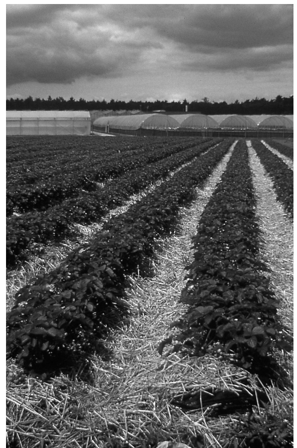
Abb. 3: Trotz anbautechnischer Möglichkeiten, den Zeitpunkt der Erdbeerernte zu steuern, hat die Erntestaffelung durch den Anbau von Sorten aus verschiedenen Reifegruppen einen hohen Stellenwert.

Der Anbau von spät reifenden Sorten erlaubt einen nahtlosen Übergang zwischen der auslaufenden Ernte bei der mittelfrühe reifenden Hauptsorte Elsanta und dem Erntebeginn bei den Freilandterminkulturen. Während dieser Periode verläuft der Erdbeerabsatz meistens problemlos und es werden interessante Preise erzielt. Auch bei eher schwachem Angebot müssen Erdbeeren an der Verkaufsfrente eine gute innere und äussere Qualität aufweisen. Grundvoraussetzung dafür sind Sorten mit einem hohen Qualitätsniveau. Je nach Vermarktungskonzept stellen die im Folgenden kurz beschriebenen Spätsorten prüfungswerte Ergänzungen zu den bewährten mittelfrühe reifenden Sorten Thuriga und Symphony dar (Tab. 1 und 2, Abb. 1 und 2):